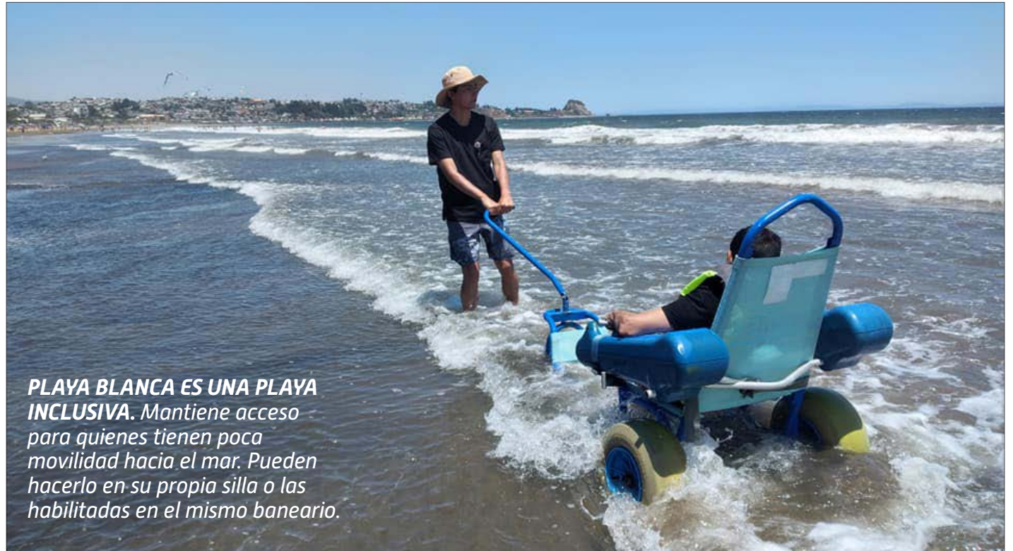
PLAYA BLANCA ES UNA PLAYA INCLUSIVA. Mantiene acceso para quienes tienen poca movilidad hacia el mar. Pueden hacerlo en su propia silla o las habilitadas en el mismo baneario.

Otro lugar maravilloso para conectar con el pasado minero es el sector Puchoco Schwager destaca por su valor paisajístico en la transformación del es-