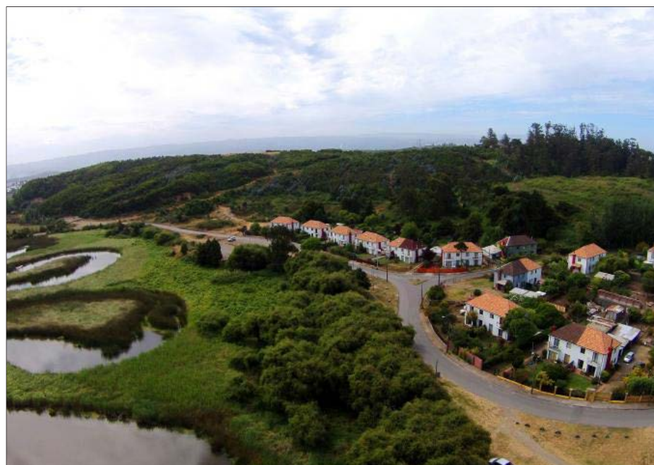
PUCHOCO SCHWAGER un sitio maravilloso que transporta al pasado minero.

Playas, isla, campo y un desarrollo inmobiliario y comercial creciente. Coronel es un lugar que tiene muchísimo por ofrecer y para sorprender a quienes visitan la ciudad. Y si bien conectamos más con el mar, el pasado glorioso del carbón, la arquitectura y sitios menos conocido conforman un eje interesante y digno de ser descubierto.