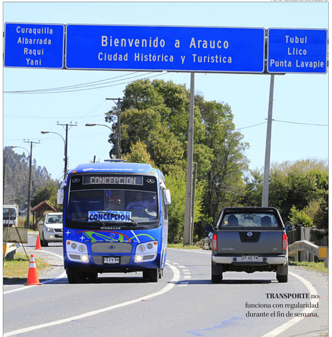
TRANSPORTE no funciona con regularidad durante el fin de semana.

“En ese sentido, el Biotrén, de igual forma, permitiría descongestionar la Ruta 160, que es la única alternativa para unir la provincia de Arauco y Concepción. La vía de conexión no se encuentra en buenas condiciones, tiene baches, que requieren reparación constante. Hablamos de arreglos kilométricos, animales en la