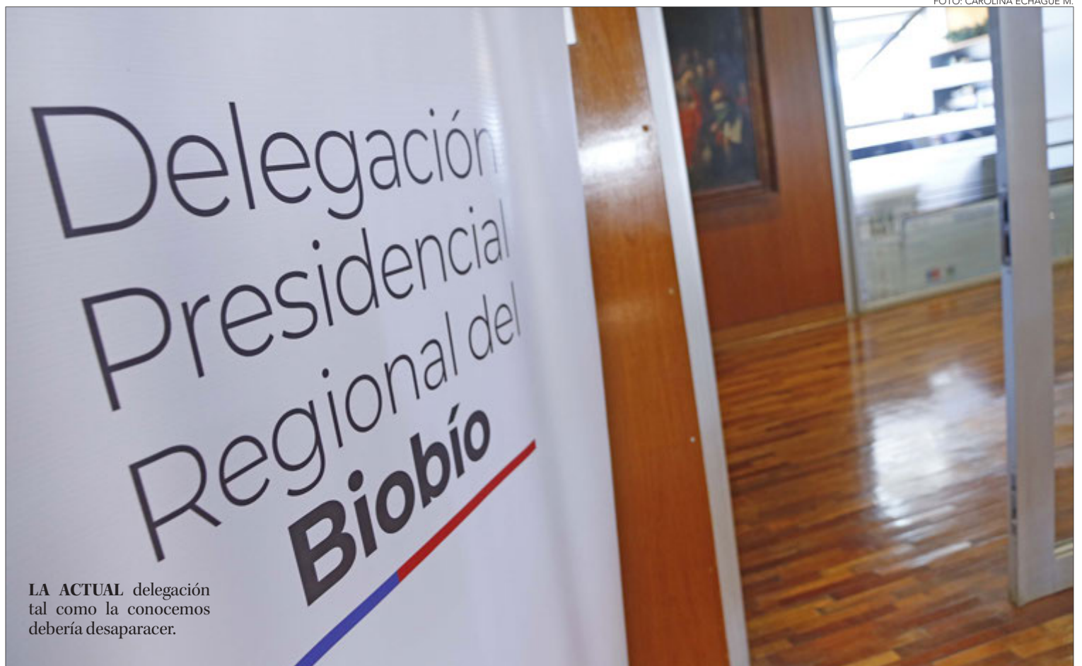
LA ACTUAL delegación tal como la conocemos debería desaparecer.

No mucho. Consultados algunos parlamentarios del oficialismo, se manifestaron a favor del término del cargo, pero clarificaron que no existen indicios de una pronta discu-