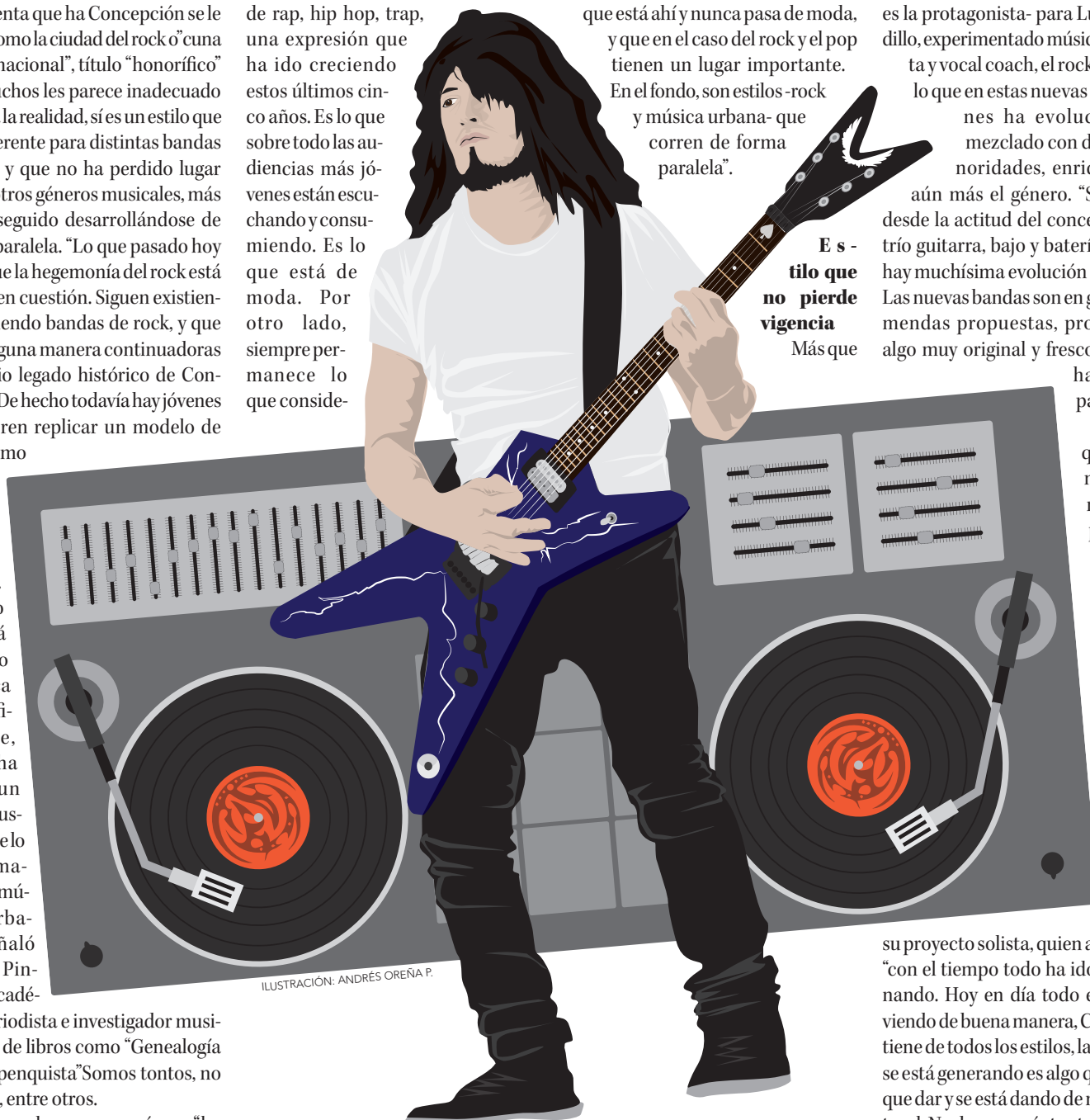
ILUSTRACIÓN: ANDRÉS OREÑA P.

Twitter @DiarioConce contacto@diarioconcepcion.cl