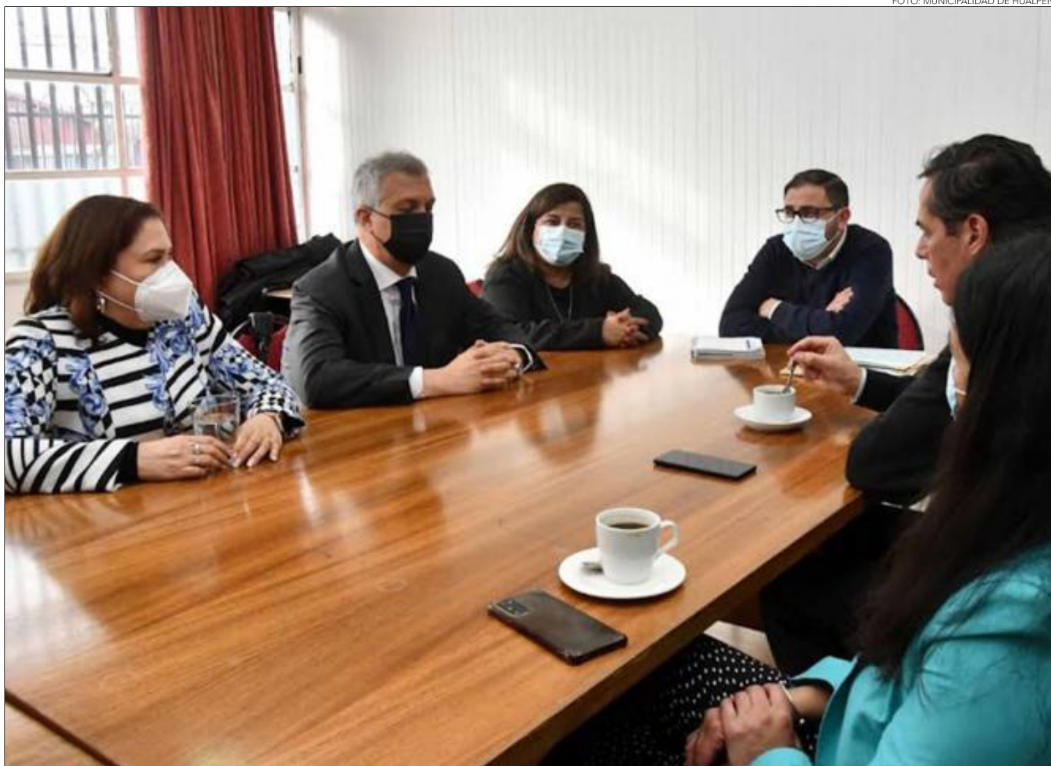
LA REUNIÓN entre los personeros se efectuó la tarde del viernes en la municipalidad de Hualpén.