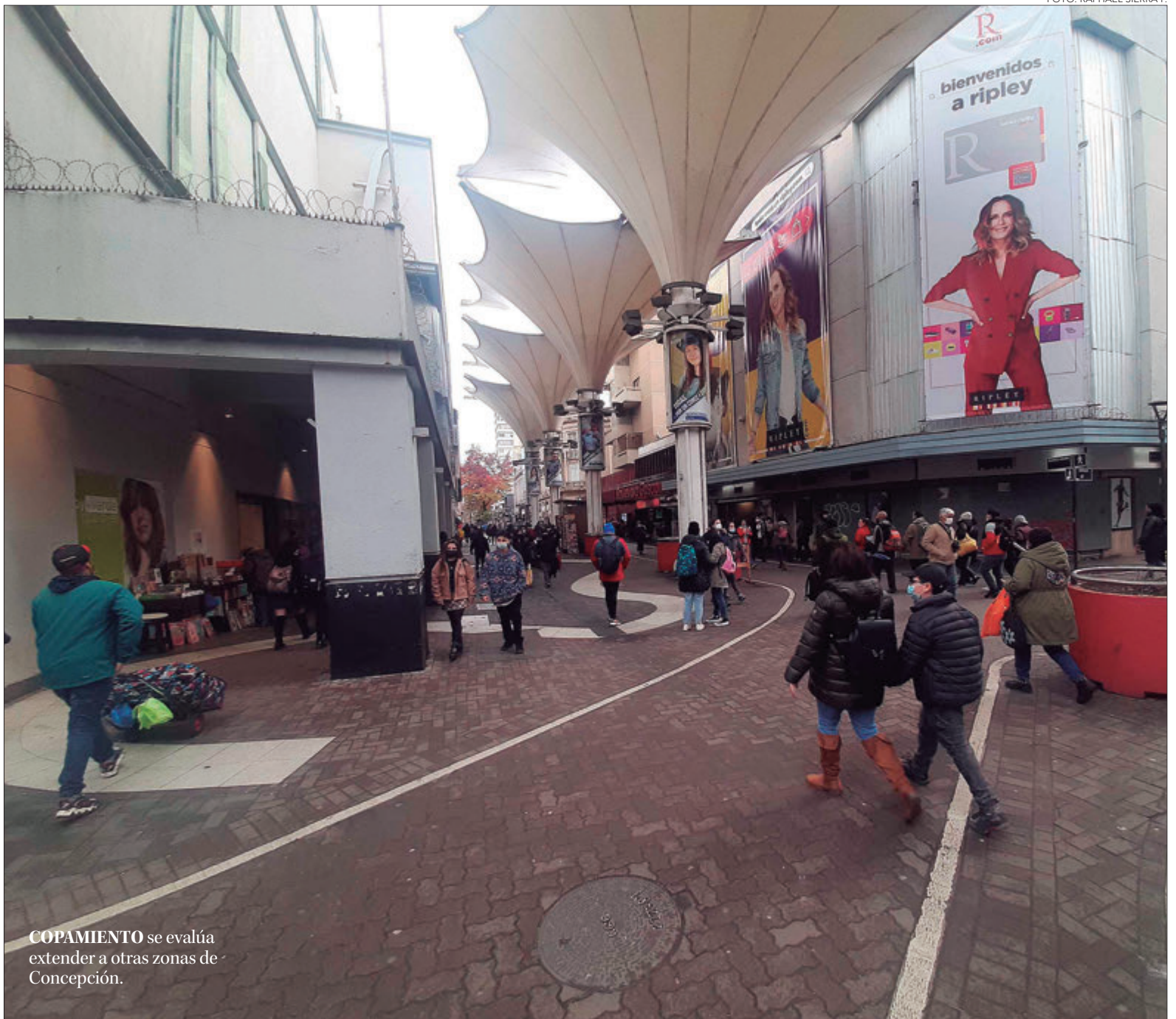
COPAMIENTO se evalúa extender a otras zonas de Concepción.