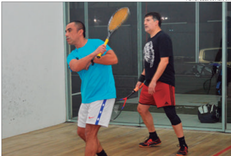
ESTADIO ESPAÑOL recibió el segundo torneo del circuito seniors.