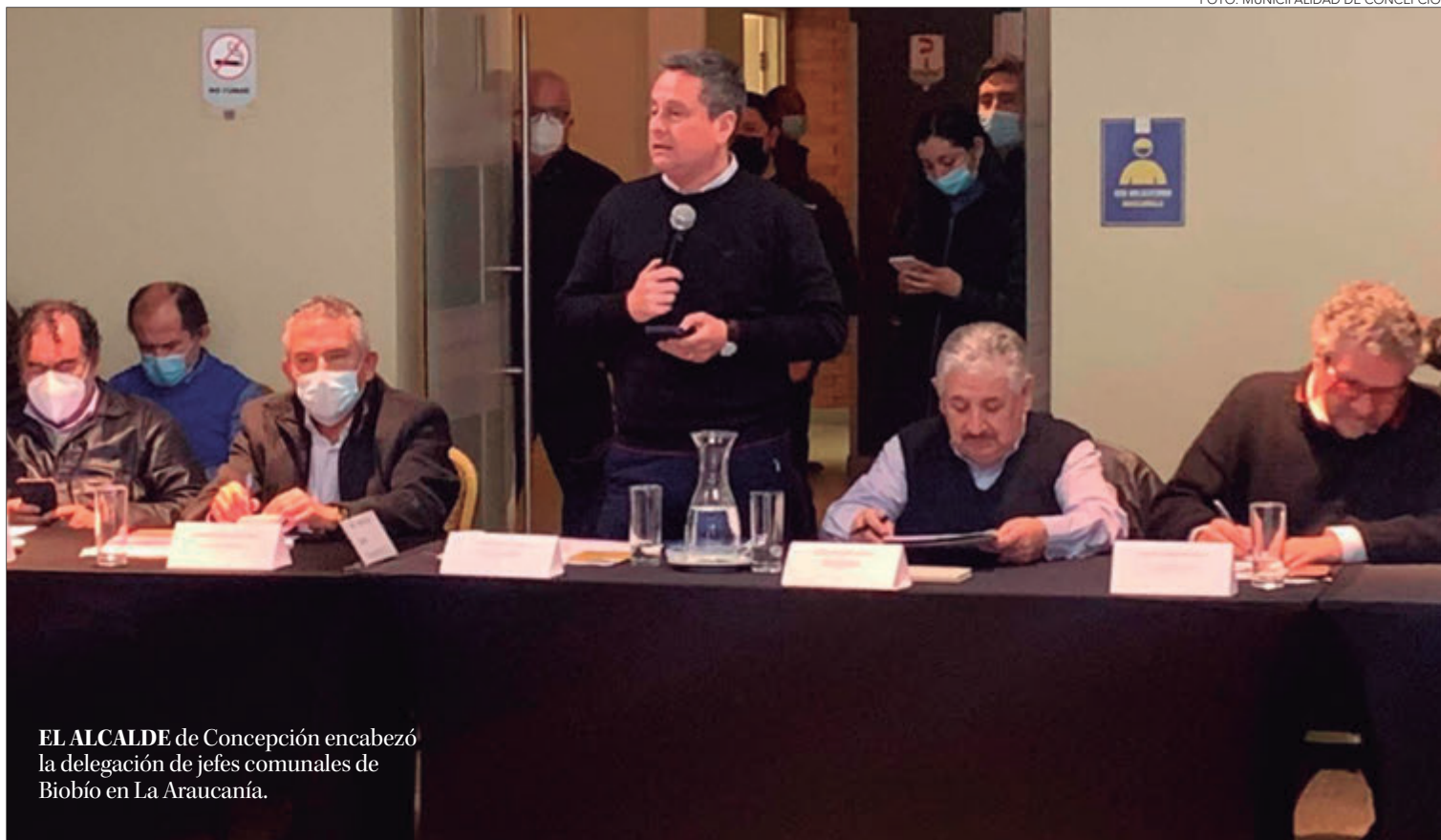
EL ALCALDE de Concepción encabezó la delegación de jefes comunales de Biobío en La Araucanía.

El jefe comunal penquista dijo que es necesario “poner un atajo ahora”