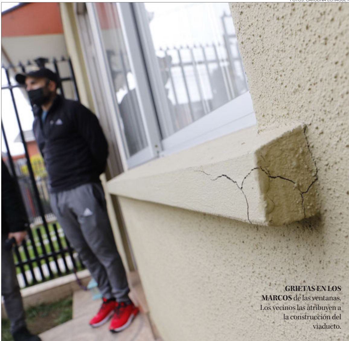
GRIETAS EN LOS MARCOS de las ventanas. Los vecinos las atribuyen a la construcción del viaducto.

MANIFESTACIÓN BLOQUEÓ CIRCULACIÓN EN LA COSTANERA DE HUALPÉN