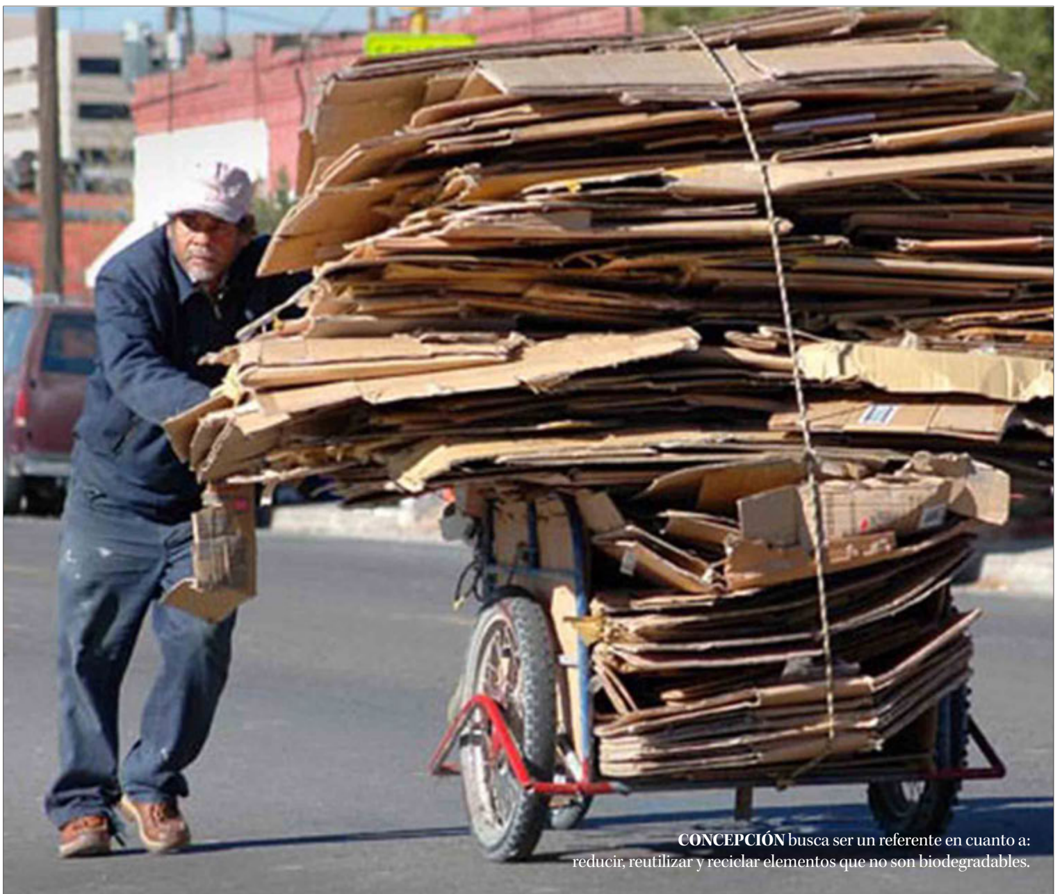
CONCEPCIÓN busca ser un referente en cuanto a: reducir, reutilizar y reciclar elementos que no son biodegradables.

“Los recicladores cumplen un servicio de utilidad pública comunal y considerando que es un beneficio de todos, debiese abordarse la posibilidad que puedan ser parte de la municipalidad o generar una colaboración mensual que les permita