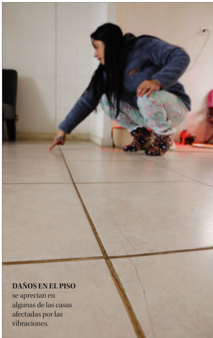
DAÑOS EN EL PISO se aprecian en algunas de las casas afectadas por las vibraciones.