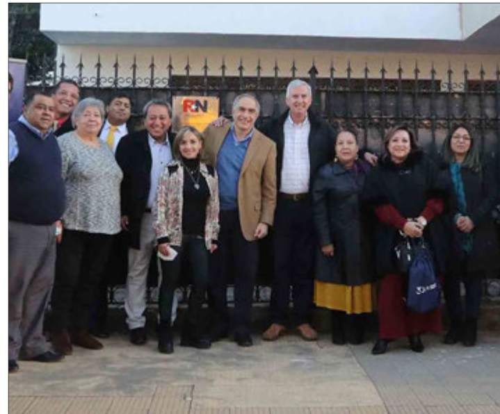
EL SENADOR y presidente nacional de RN participó de la reinauguración de la sede del partido en Concepción.