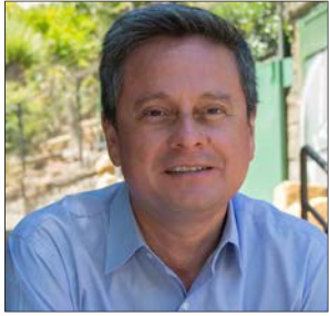
Rodrigo Díaz, gobernador regional del Biobío.

“La forma en que el gobierno se relacionará con los municipios no sólo estando en el territorio. Más descentralización”.