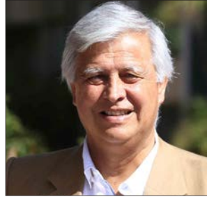
Enrique van Rysselberghe, senador de la UDI.

“Debe mencionar cuando parte el programa de transformaciones en pensiones, salud y derechos laborales”.