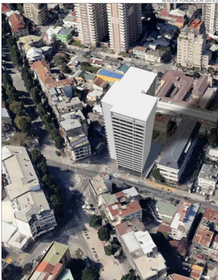
RENDER: FUNDACIÓN SINTESIS

Sin embargo, el alcalde aclaró que “nosotros cuando llegamos a la gestión municipal, teníamos en el PRC, construcciones en altura libre, es