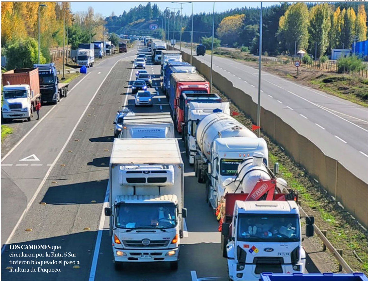
LOS CAMIONES que circularon por la Ruta 5 Sur tuvieron bloqueado el paso a la altura de Duqueco.