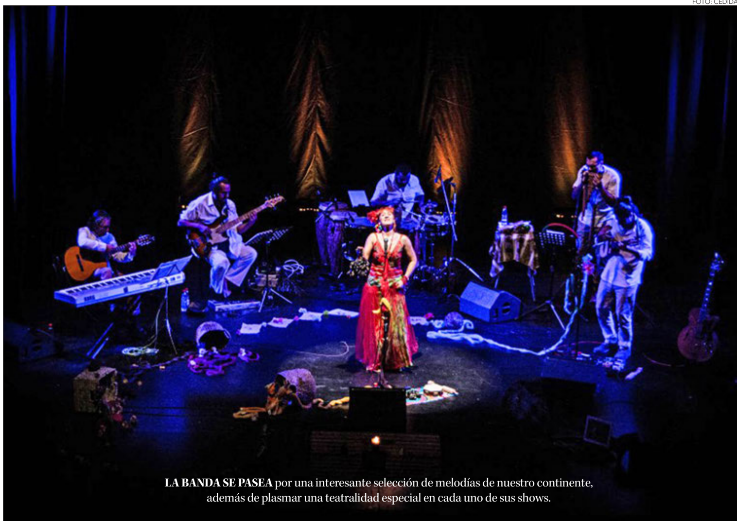
LA BANDA SE PASEA por una interesante selección de melodías de nuestro continente, además de plasmar una teatralidad especial en cada uno de sus shows.

Este ímpetu y empuje de rodaje en vivo ha abierto las posibilidades de seguir creando más material de estudio, es decir, en palabras de ella "ya queremos registrar nuestra segunda producción, como que de pronto empezó a avanzar todo de manera muy