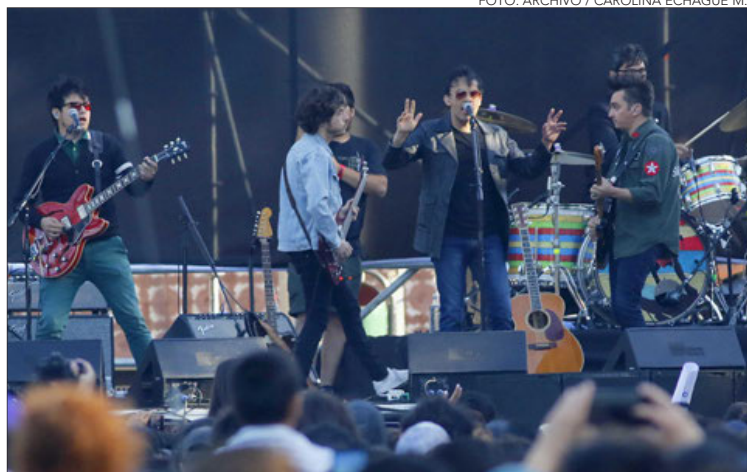
EL 2019 el quinteto realizó un masivo concierto en la UdeC.