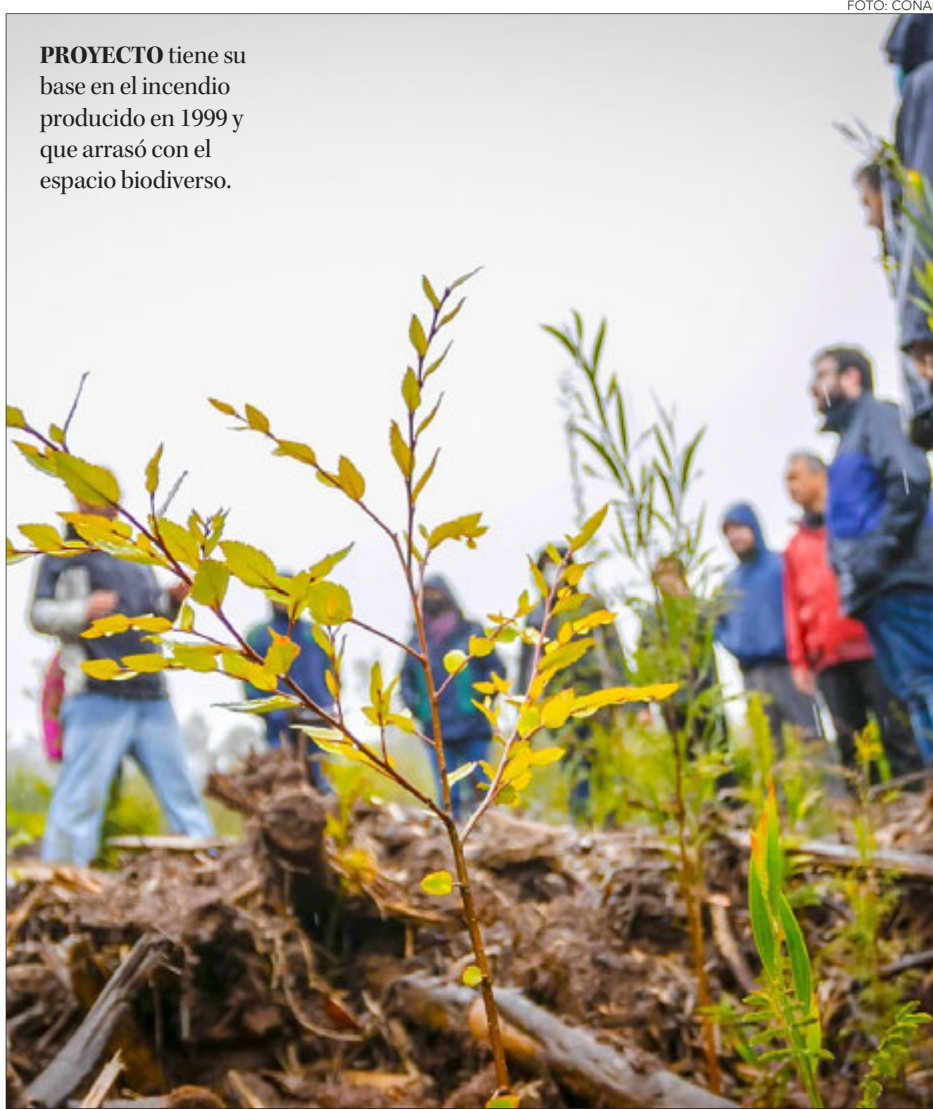
PROYECTO tiene su base en el incendio producido en 1999 y que arrasó con el espacio biodiverso.

Twitter @DiarioConce contacto@diarioconcepcion.cl