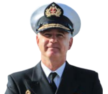
JORGE PARGA BALARESQUE Comandante en Jefe de la Segunda Zona Naval.

ro de ASMAR Talcahuano. En sus 14 años de servicio, la Unidad Naval con apoyo de aviones y helicópteros ha recorrido desde la costa hasta áreas que están más allá de las 200 millas de la Zona Económica Exclusiva (ZEE), en aguas internacionales, con la misión de resguardar la soberanía, el desarrollo de nuestra nación en los espacios marítimos y los recursos marinos, con especial énfasis en la sostenibilidad de los recursos transzonales y