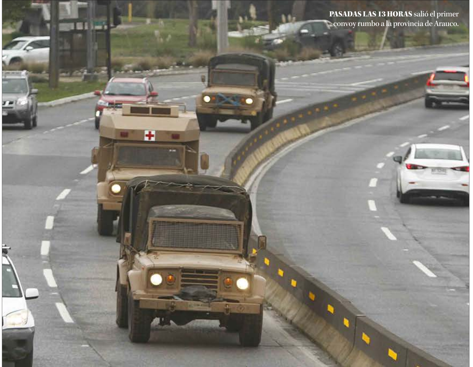
PASADAS LAS 13 HORAS salió el primer convoy rumbo a la provincia de Arauco.