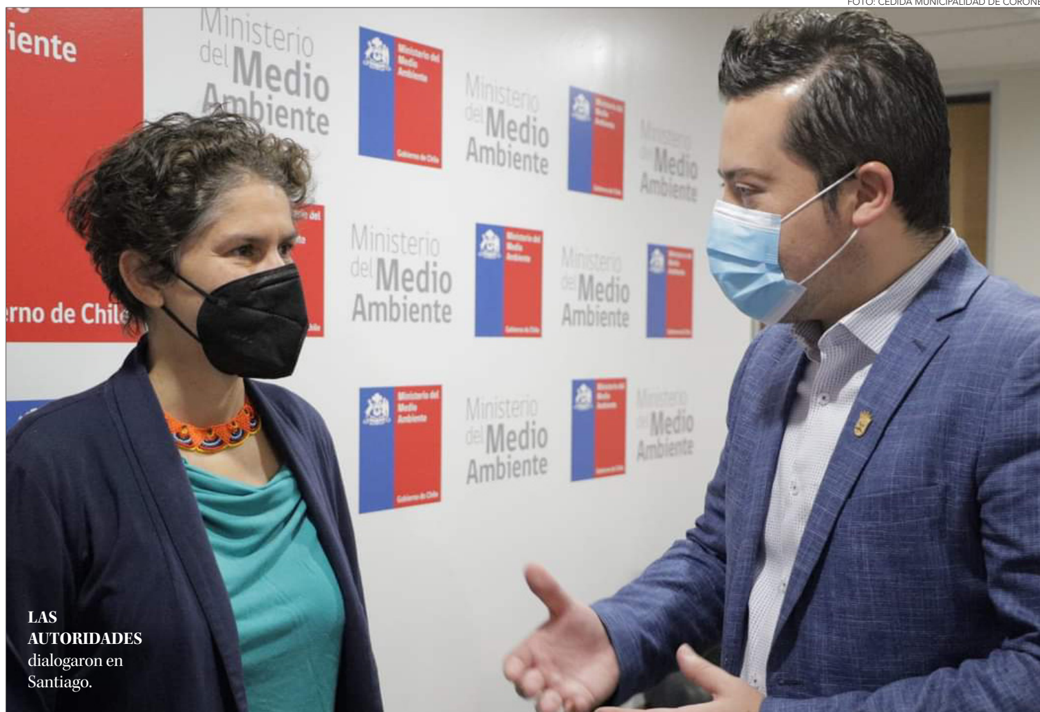
LAS AUTORIDADES dialogaron en Santiago.