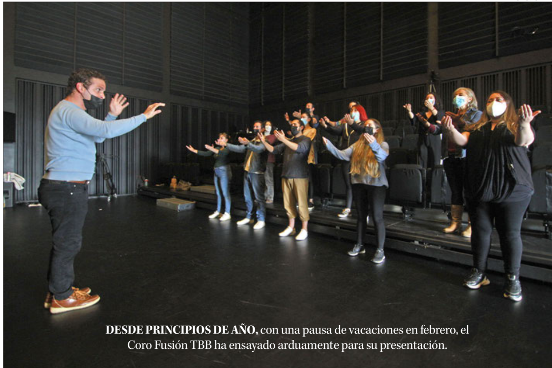
DESDE PRINCIPIOS DE AÑO, con una pausa de vacaciones en febrero, el Coro Fusión TBB ha ensayado arduamente para su presentación.