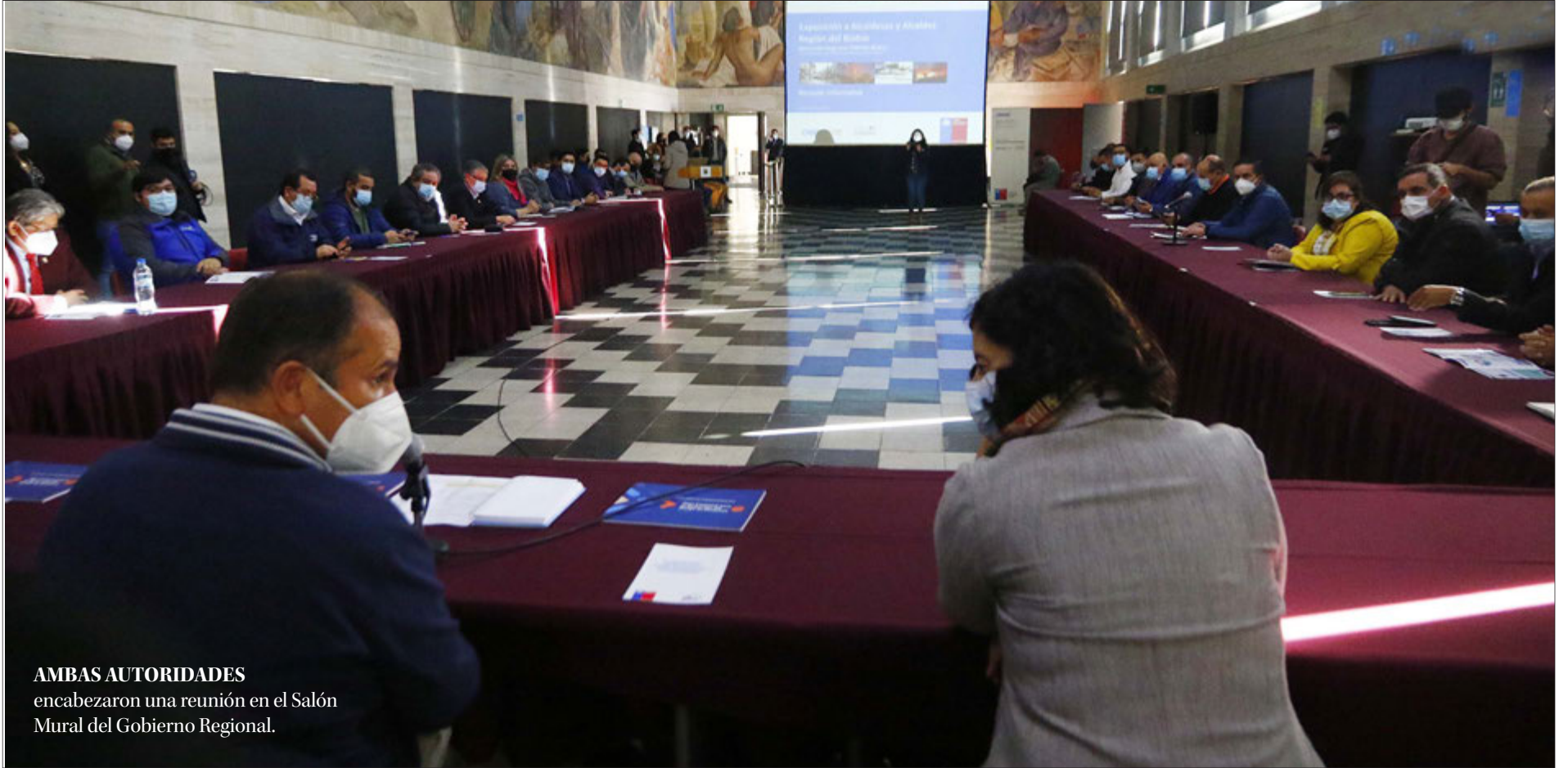
AMBAS AUTORIDADES encabezaron una reunión en el Salón Mural del Gobierno Regional.

Ángel Rogel Álvarez angel.rogel@diarioconcepcion.cl