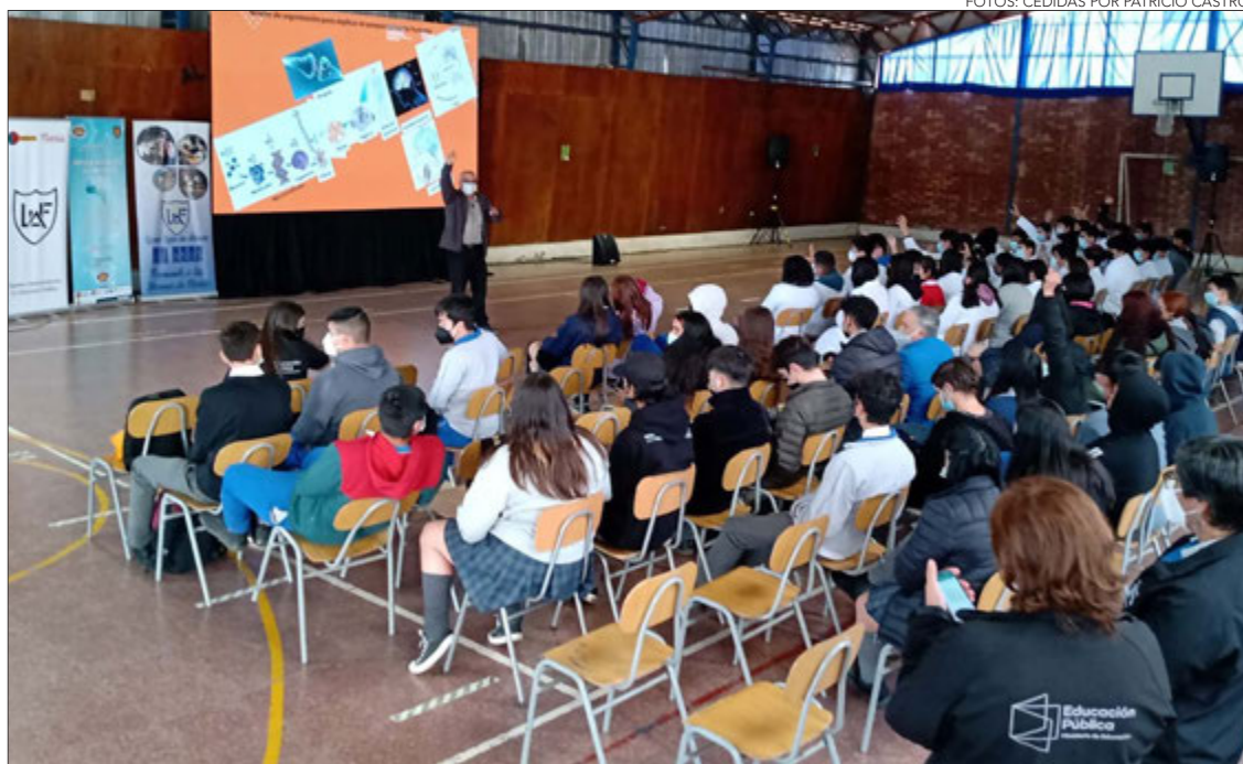
COMUNIDAD ESCOLAR de Florida se reunió en dos liceos de la comuna para BAW 2022.

Twitter @DiarioConcepcion contacto@diarioconcepcion.cl