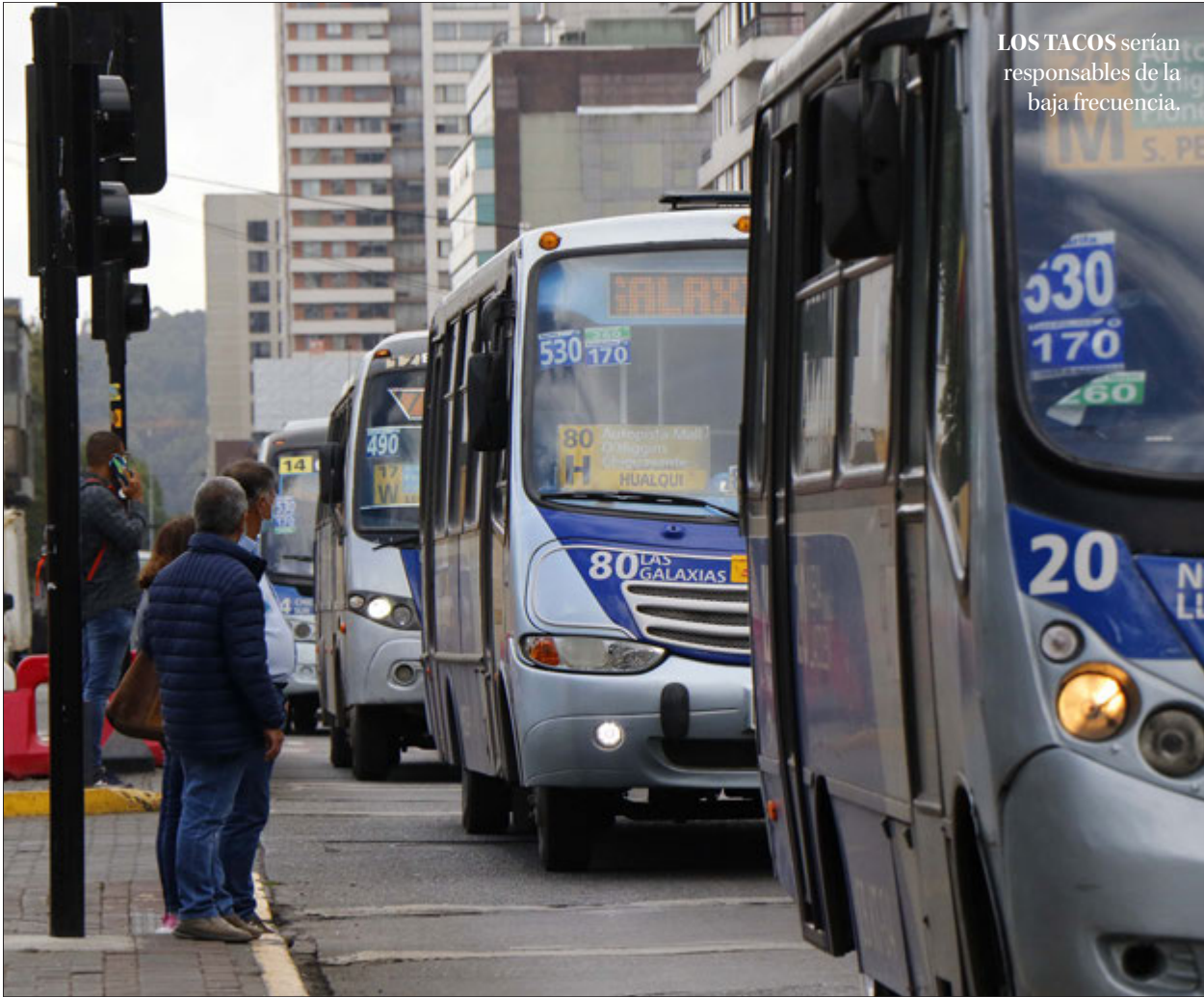
LOS TACOS serían responsables de la baja frecuencia.