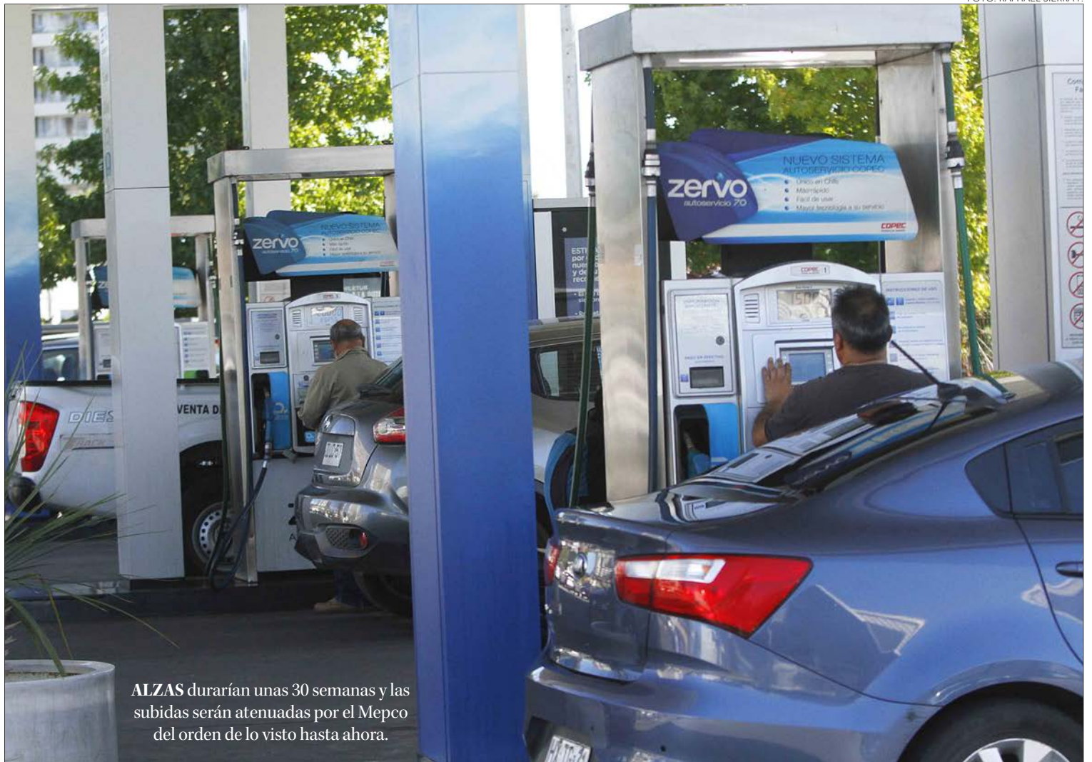
ALZAS durarían unas 30 semanas y las subidas serán atenuadas por el Mepco del orden de lo visto hasta ahora.

Efectivamente, ante esta realidad y para evitar subidas estrepitosas de hasta $50, el Gobierno decidió intervenir y modificar los parámetros del Fondo de Estabilización de Precios de los Combustibles (Mepco), de manera tal de amortiguar y lograr que