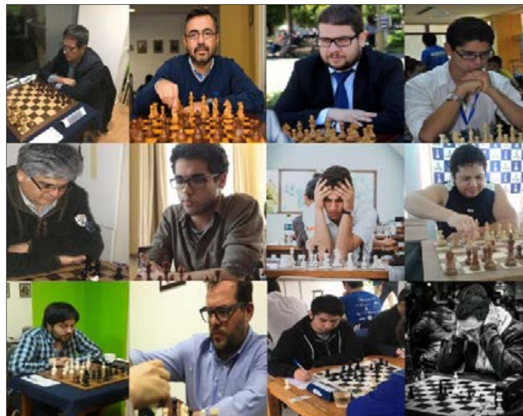
EL TORNEO SE jugará al sistema suizo, a cinco rondas.

Twitter @DiarioConcepcion contacto@diarioconcepcion.cl