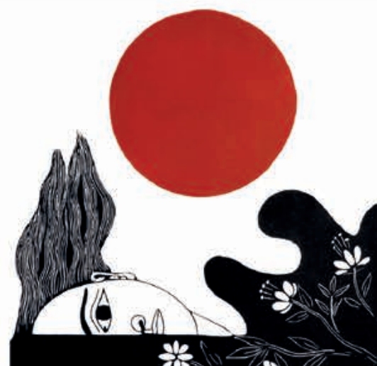
"Parece que nace con la tierra". Xilografía, 36 x 36 cm.

pictórica de Santos Chávez se vio estrechamente unida a su destreza y reconocimiento en el ámbito del grabado, siendo su técnica característica la xilografía (grabado en madera), porque ésta era la que más se adecuaba a sus fines expresivos y figurativos, ya que se obtienen trazos gruesos que se acomodan más a sus cálidos dibujos. El artista formó parte de la renovación de la técnica del grabado en la década del 60, lo cual cimentó el resto de su obra, centrada en el paisaje.