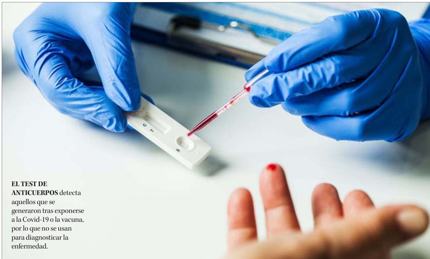
EL TEST DE ANTICUERPOS detecta aquellos que se generaron tras exponerse a la Covid-19 o la vacuna, por lo que no se usan para diagnosticar la enfermedad.

Ante todos estos panoramas, el científico es enfático en afirmar que nada de lo expuesto tiene que ver con que las técnicas no sirvan, que falte prolijidad o que falló un profesional o el laboratorio, sino que es parte de un margen de error normal que no sólo se da para esta enfermedad e, incluso, diferencias en las técnicas de análisis específicas usadas. Eso sí, pone el acento en que "el porcentaje de falsos positivos y negativos es muy bajo", dentro de todo el gran universo de testeos.