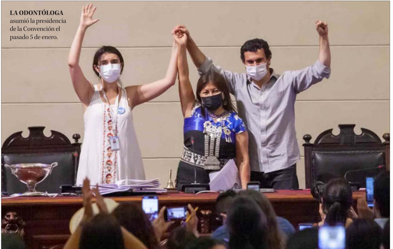
LA ODONTÓLOGA asumió la presidencia de la Convención el pasado 5 de enero.