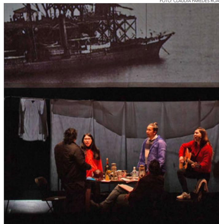
EL MONTAJE se estrenó el año pasado primero en formato virtual, para luego realizar funciones presenciales en el Teatro Biobío.

OPINIONES Twitter @DiarioConcepcion contacto@diarioconcepcion.cl