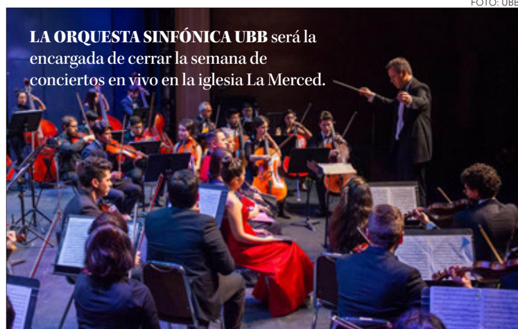
LA ORQUESTA SINFÓNICA UBB será la encargada de cerrar la semana de conciertos en vivo en la iglesia La Merced.

Twitter @DiarioConcepcion contacto@diarioconcepcion.cl