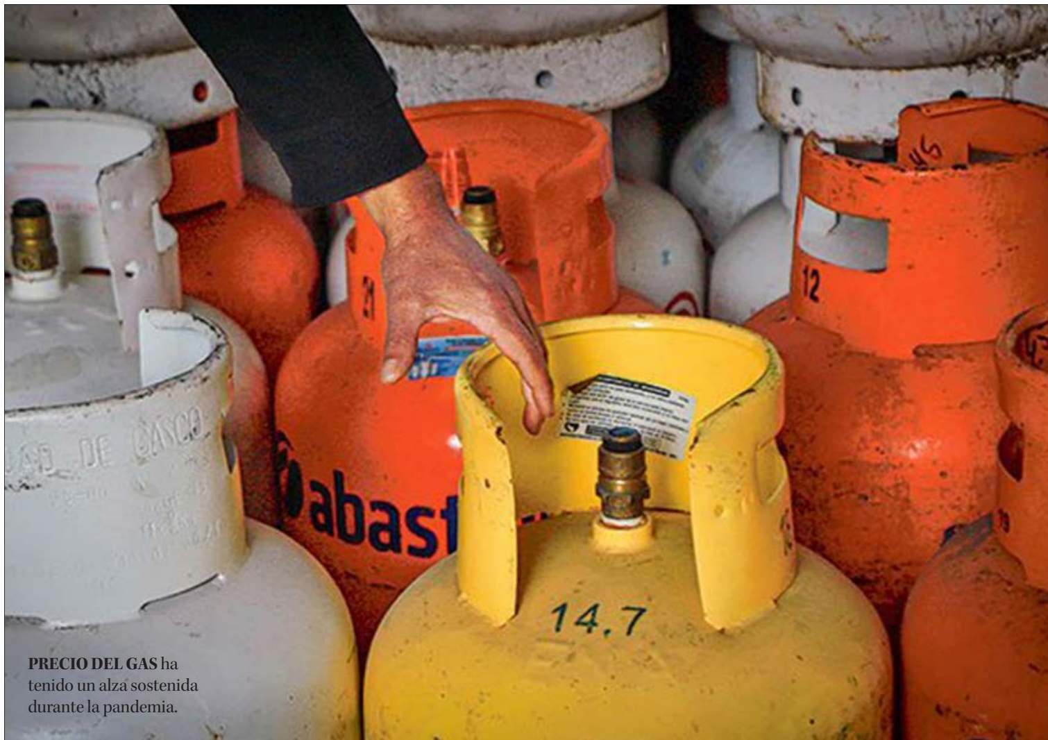
PRECIO DEL GAS ha tenido un alza sostenida durante la pandemia.

Respecto al anuncio realizado por el Ejecutivo, el parlamentario lo catalogó como una reacción