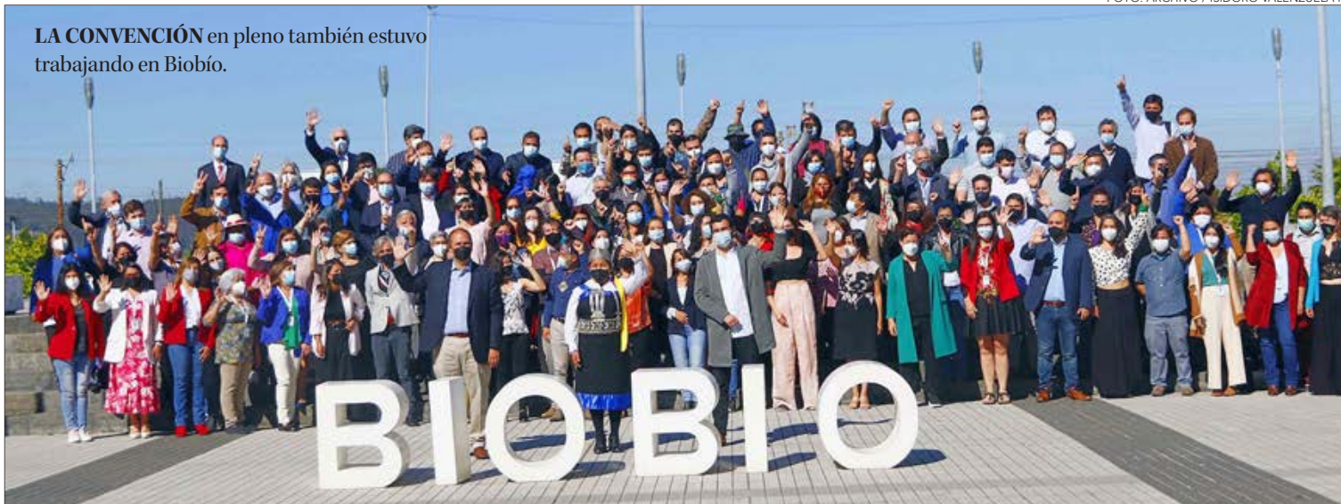
LA CONVENCION en pleno también estuvo trabajando en Biobío.