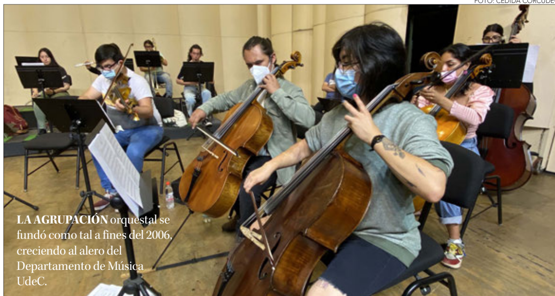
LA AGRUPACIÓN orquestal se fundó como tal a fines del 2006, creciendo al alero del Departamento de Música UdeC.