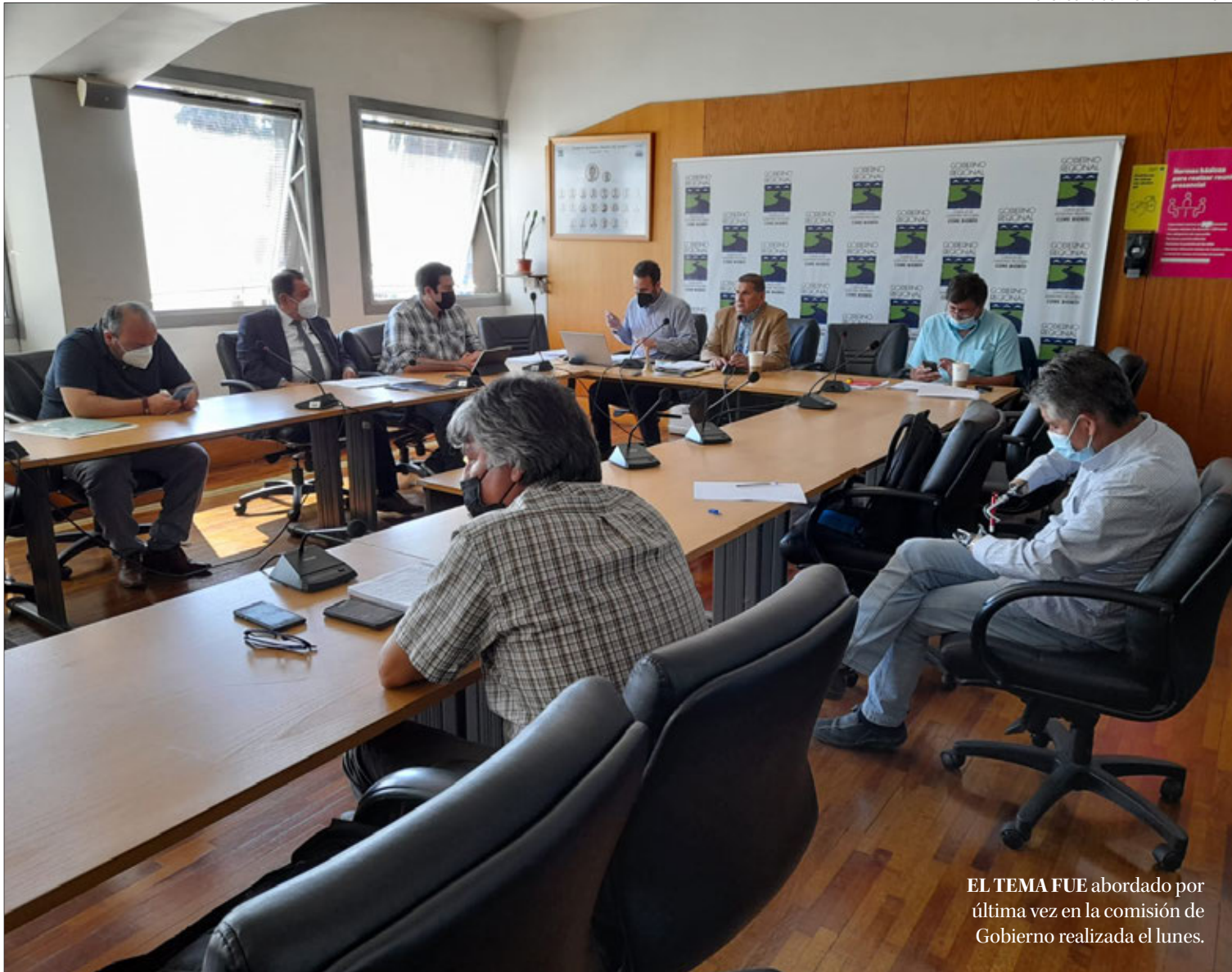
EL TEMA FUE abordado por última vez en la comisión de Gobierno realizada el lunes.