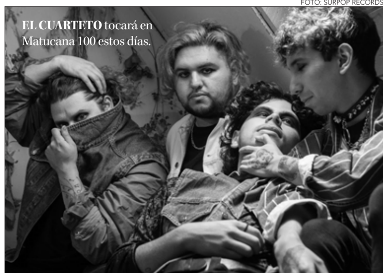
EL CUARTETO tocará en Matucana 100 estos días.

Twitter @DiarioConcepcion contacto@diarioconcepcion.cl