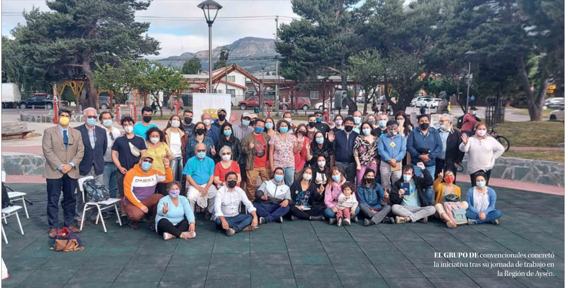
EL GRUPO DE convencionales concretó la iniciativa tras su jornada de trabajo en la Región de Aysén.

Ángel Rogel Álvarez angel.rogel@diarioconcepcion.cl