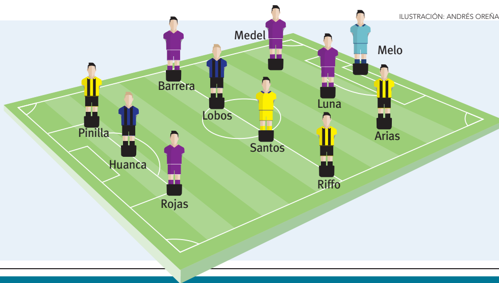
ILUSTRACIÓN: ANDRÉS OREÑA