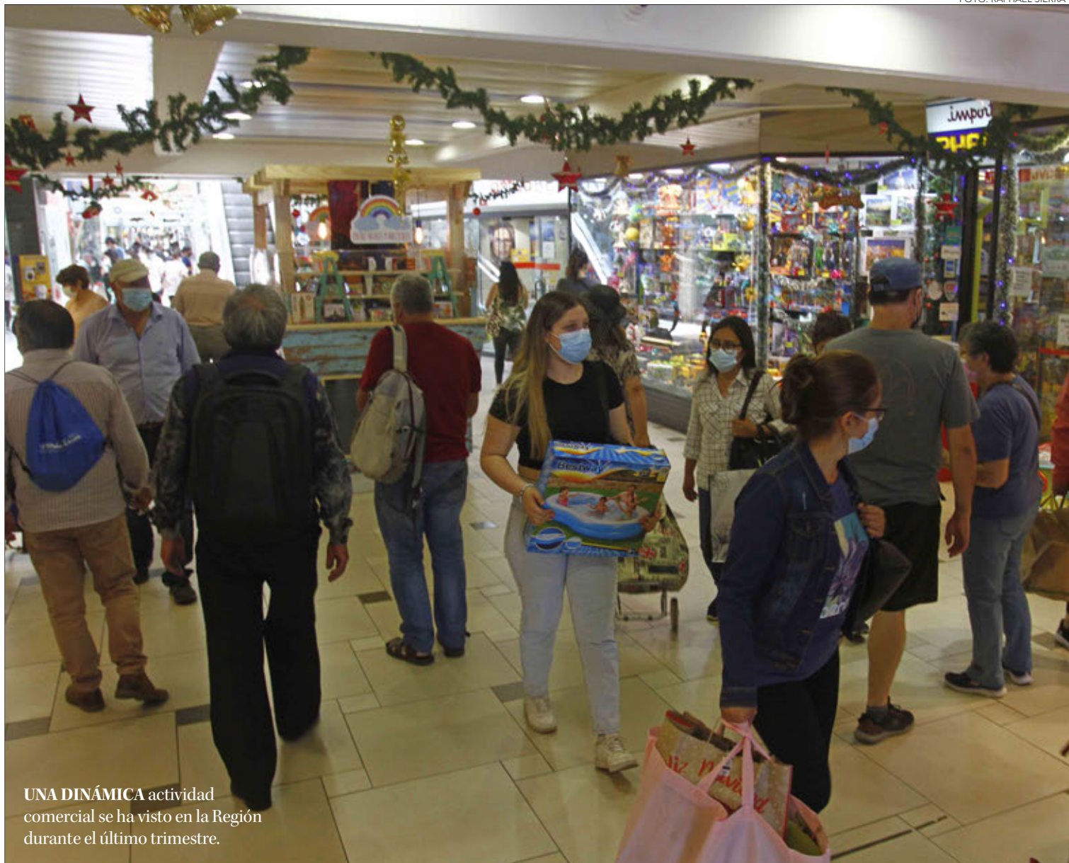
UNA DINÁMICA actividad comercial se ha visto en la Región durante el último trimestre.

Respecto a la proyección de diciembre, el objetivo es que los socios de la Cámara tomen fuerzas para el otro año. “Nuestra gente estaba esperando un momento así, por lo que esperamos que puedan proyec-