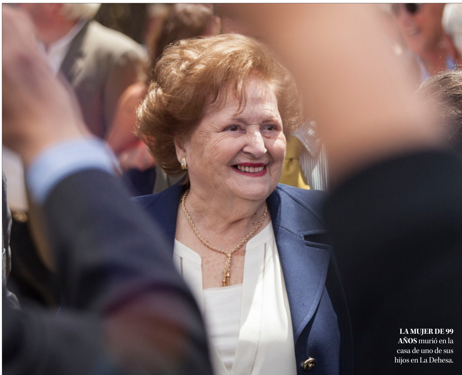
LA MUJER DE 99 AÑOS murió en la casa de uno de sus hijos en La Dehesa.

Desde los sectores del progresismo criticaron la impunidad que benefició a una de las figuras más controversiales de nuestra historia. Al cierre de esta edición no existía pronunciamiento de los representantes de la derecha política.