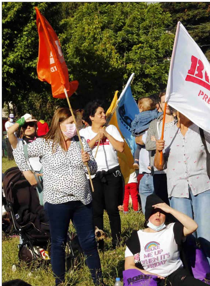
LOS SEGUIDORES de Gabriel Boric se concentraron en el Parque Laguna Grande en San Pedro de la Paz.

En lo referido a los cierres de campaña, quienes apoyan a la carta de