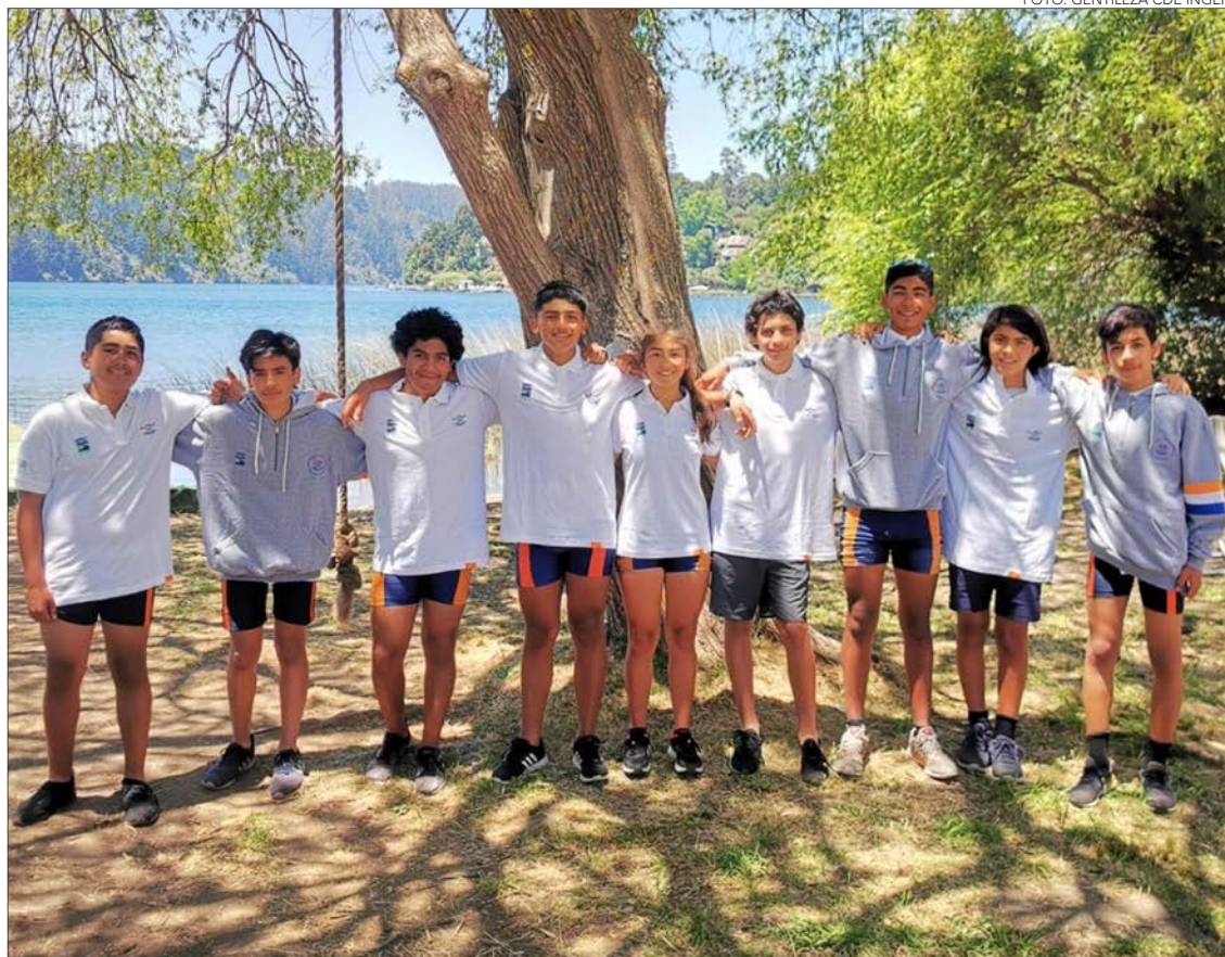
DEPORTISTAS QUE FUERON PARTE DEL Nacional de Series Bajas, donde el CDE Inger fue protagonista.