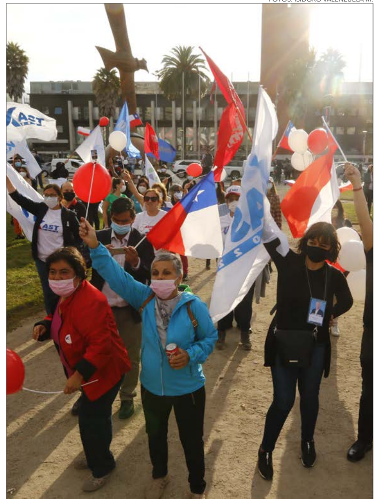
AUNQUE TUVIERON un cierre regional en Los Ángeles, en Concepción los adherentes de José Antonio Kast tuvieron un “mujerazo”.

En el caso del candidato del Frente Social Cristiano, el acto principal