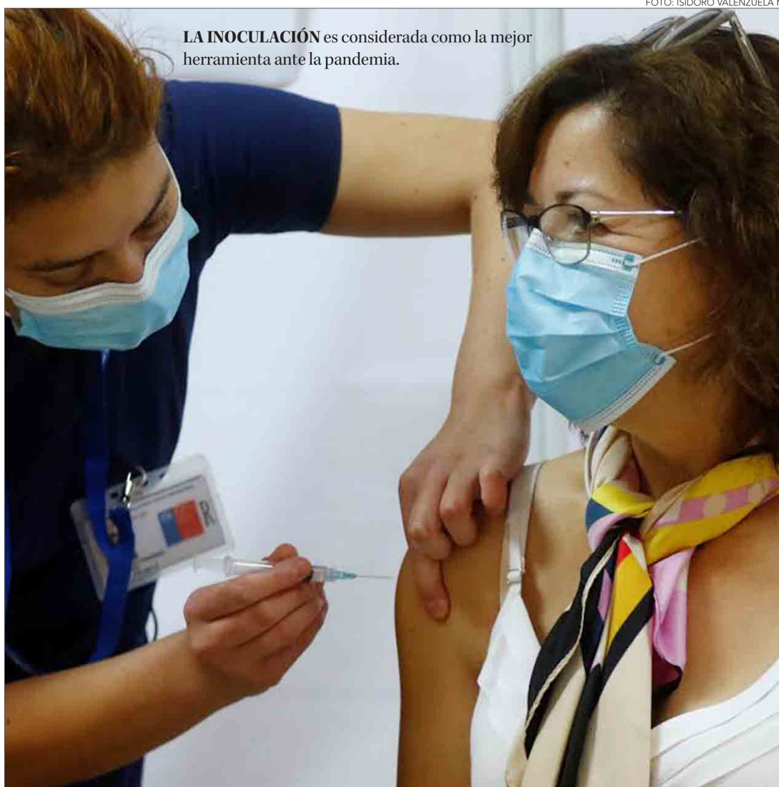
LA INOCULACIÓN es considerada como la mejor herramienta ante la pandemia.

La Región tiene el 16% de los casos nuevos registrados en el país. Gobierno da a conocer nueva campaña “No invites al Covid” y no descarta inoculación de una cuarta dosis.