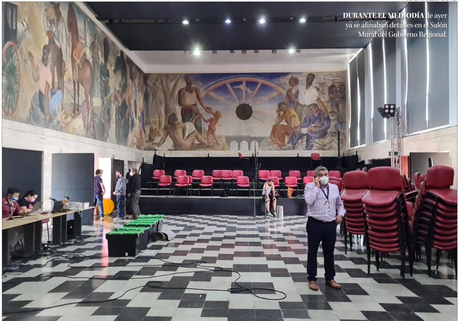
DURANTE EL MEDIODÍA de ayer ya se afinaban detalles en el Salón Mural del Gobierno Regional.

Además del plenario, este día se firmará de un convenio de colaboración con la Universidad de Concepción, en la Casa de Deportes, y luego se realizará un foro denominado “Conocimiento, educación superior y universidad. Miradas des-