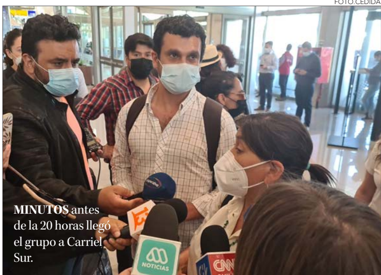
MINUTOS antes de las 20 horas llegó el grupo a Carriel Sur.

Twitter @DiarioConce contacto@diarioconcepcion.cl