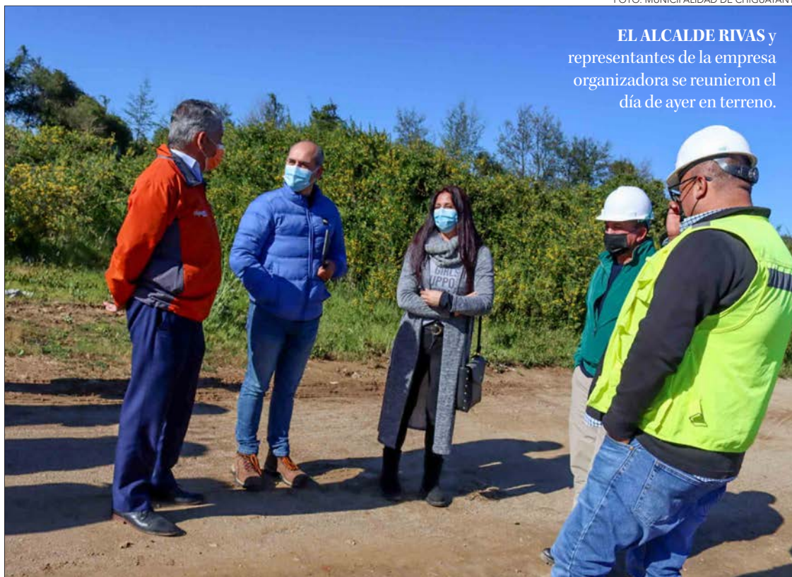
EL ALCALDE RIVAS y representantes de la empresa organizadora se reunieron el día de ayer en terreno.