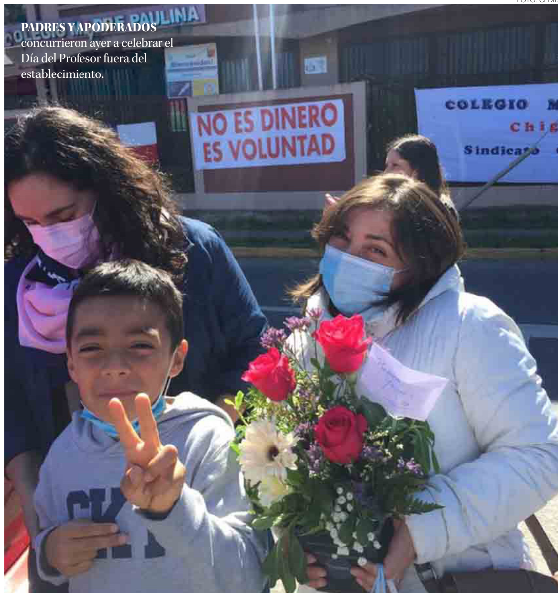
PADRES Y APODERADOS concurren ayer a celebrar el Día del Profesor fuera del establecimiento.

Colegio Madre Paulina, dependiente de la Inmaculada Concepción, está en huelga hace tres semanas. Exigen mejoras laborales y reintegro de sus remuneraciones.