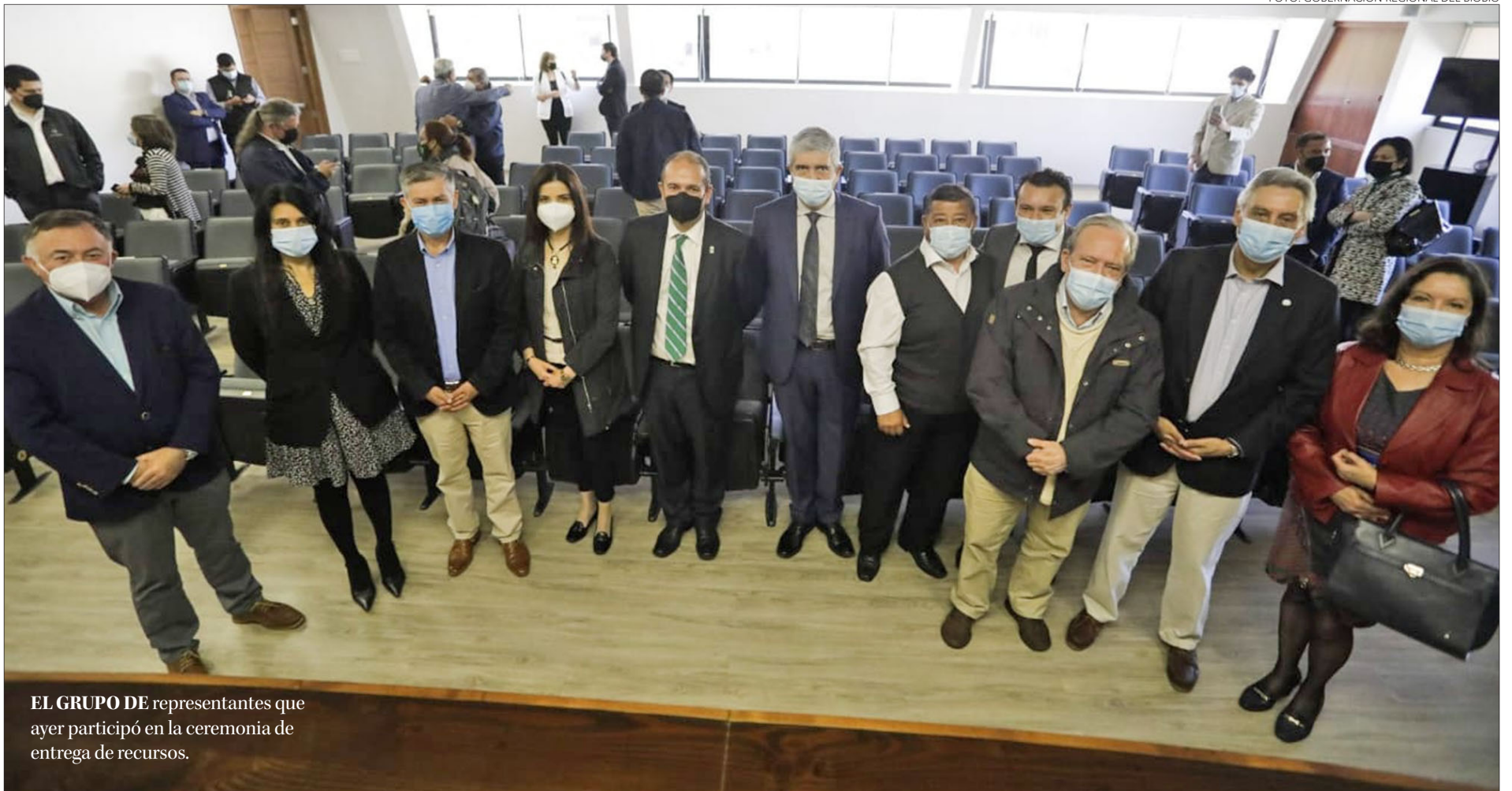
EL GRUPO DE representantes que ayer participó en la ceremonia de entrega de recursos.

Ángel Rogel Álvarez angel.rogel@diarioconcepcion.cl