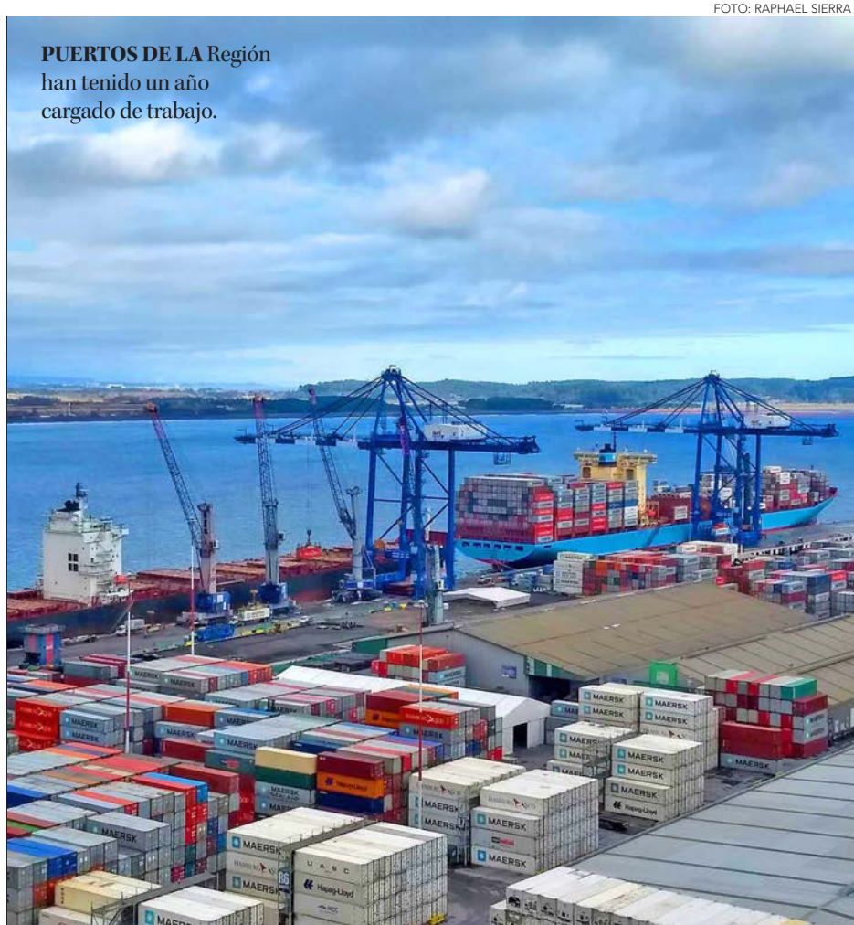
PUERTOS DE LA Región han tenido un año cargado de trabajo.

“El factor natural genera cierta ventaja para nuestra Región, porque los barcos ya no pueden recalar en la Quinta Región, por lo tanto, deben recalar en Biobío, pero