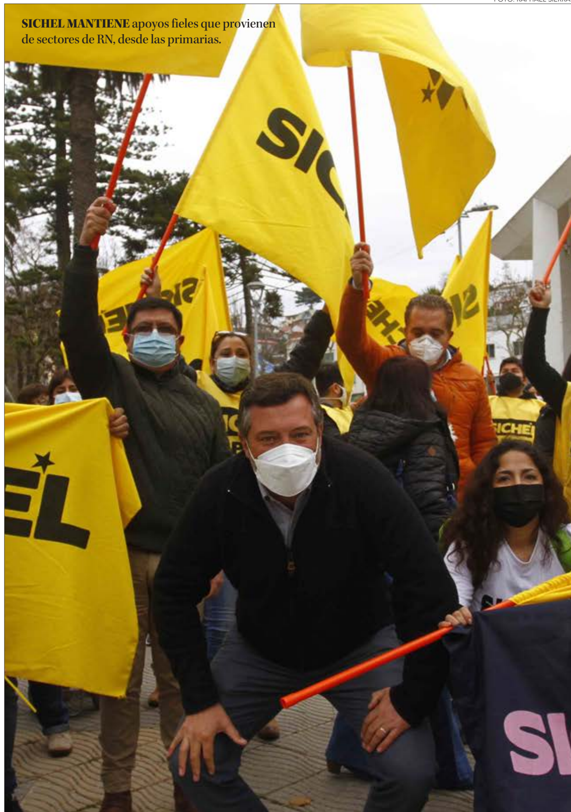
SICHEL MANTIENE apoyos fieles que provienen de sectores de RN, desde las primarias.

Las encuestas, cambios de opinión del postulante y otras situaciones han hecho que los postulantes de la zona no quieran figurar con él y prefieran aparecer solos. En los partidos esto no genera mayor problema y afirman estar cohesionados.