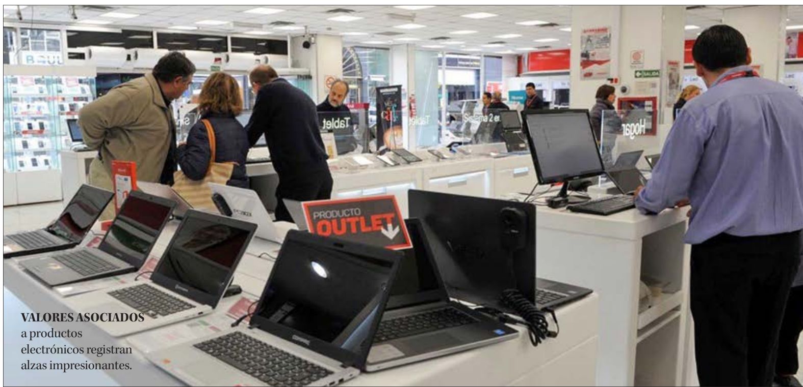
VALORES ASOCIADOS a productos electrónicos registran alzas impresionantes.

¿Por qué se da este factor? Los fenómenos influyentes para el alza de valores en la actualidad son múltiples. La más importante es el aumento en el tipo de cambio. Chile al ser un país importador de artículos electrónicos y como el dólar viene subiendo desde 2019, eso ha generado un au-