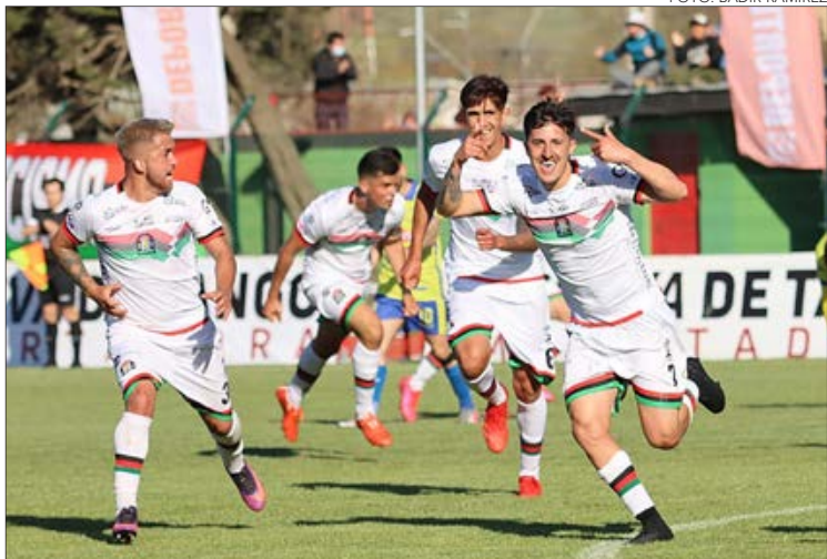
LOTA LLEVA CUATRO sin jugar con público en el Federico Schwager.