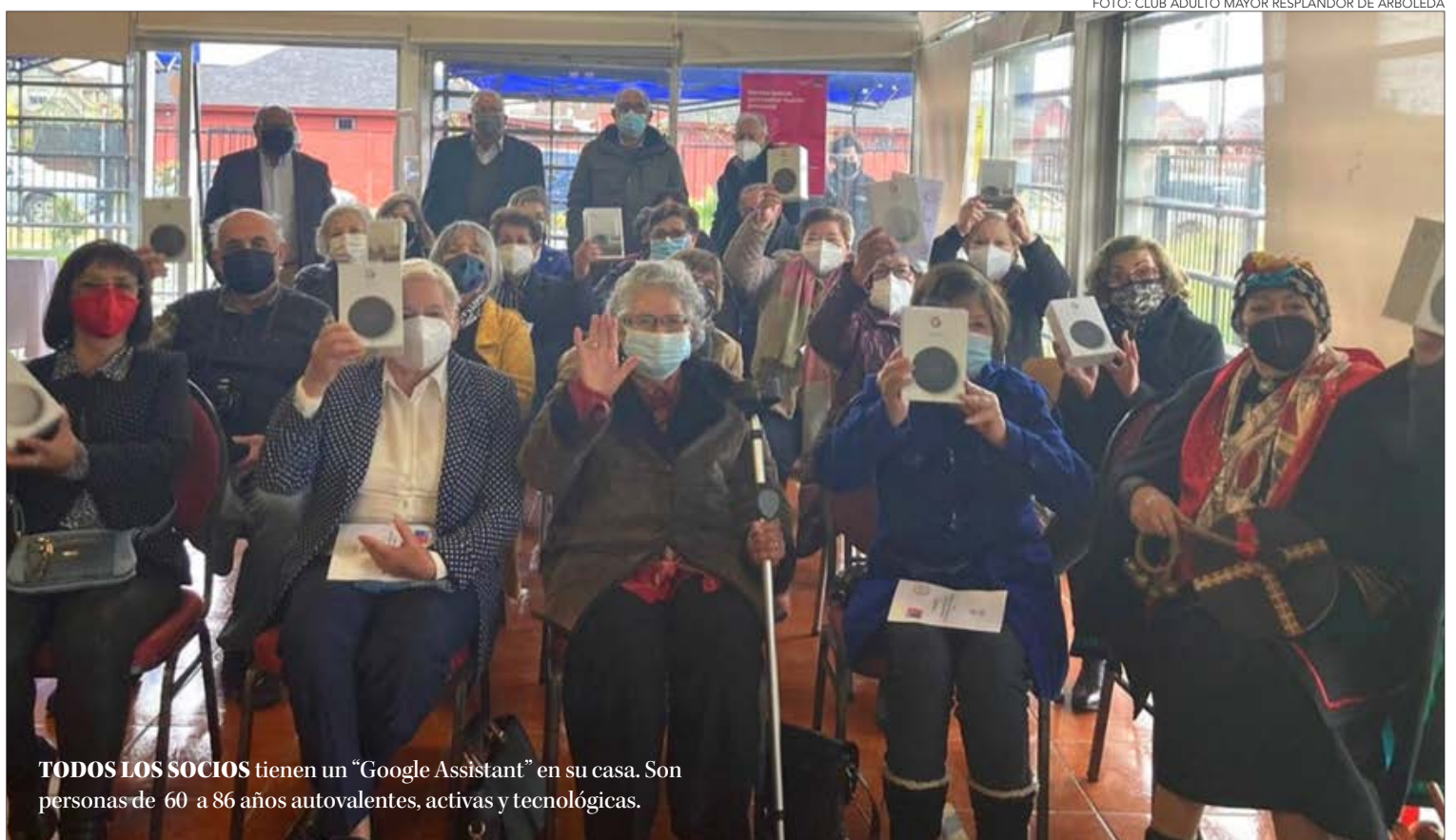
TODOS LOS SOCIOS tienen un “Google Assistant” en su casa. Son personas de 60 a 86 años autovalentes, activas y tecnológicas.

“Me encanta estar actualizada, porque debemos y podemos estar vigentes”, sostiene con una convicción que sabe que comparte con gran cantidad de integrantes de su grupo etario al que llaman tercera edad y el imaginario colectivo sobre la vejez les ve como personas con poca movilidad, enfermas, dependientes y poco tecnológicas. Lejos de la vivencia de millones de representantes del segmento. De hecho, según la Encuesta Casen 2020, la población de 60 años y más son casi 4 millones de personas en Chile y casi el 86% es autovalente, la gran mayoría activo y sólo 14% dependiente. Además, un sondeo de la startup chilena Ten, que creó la aplicación de citas para personas mayores de 50 años Tenlove, reveló que 82% de 1.500 encuestados sobre 60 años no se sienten estereotipado con el concepto ni estereotipo de la tercera edad y 86% dijo que le gusta usar aplicaciones en su smartphone y sólo 5% no sabe usarlas, pero quiere aprender para aprovecharlas. Y el “Mes de las Personas Ma-