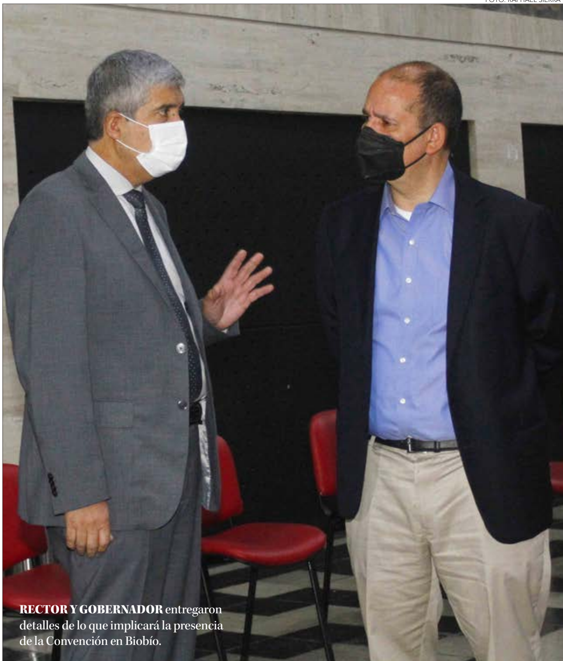
RECTOR Y GOBERNADOR entregaron detalles de lo que implicará la presencia de la Convención en Biobío.