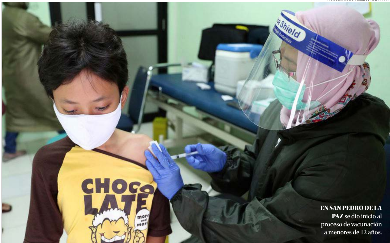
EN SAN PEDRO DE LA PAZ se dio inicio al proceso de vacunación a menores de 12 años.

La vacunación que se llevará a cabo en cuatro semanas, en coordinación entre los establecimientos y