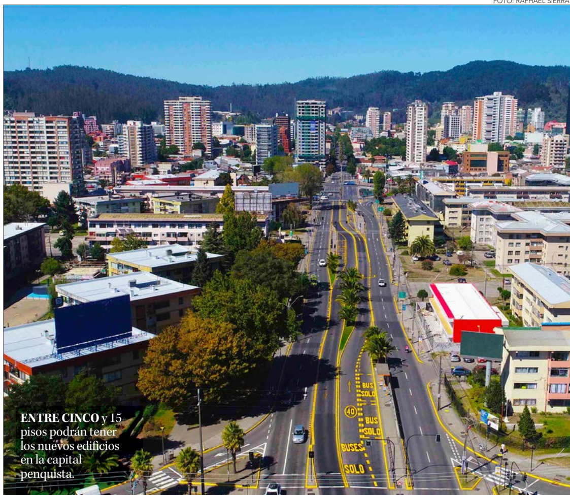
ENTRE CINCO y 15 pisos podrán tener los nuevos edificios en la capital penquista.

Tras la publicación en el Diario Oficial, el municipio penquista respetó lo acordado con la comunidad, lo que fue celebrado por organizaciones barriales, sin embargo, no estuvo exenta de críticas. Desde la CChC, por ejemplo, indicaron que la medida perjudica el acceso a la vivienda.