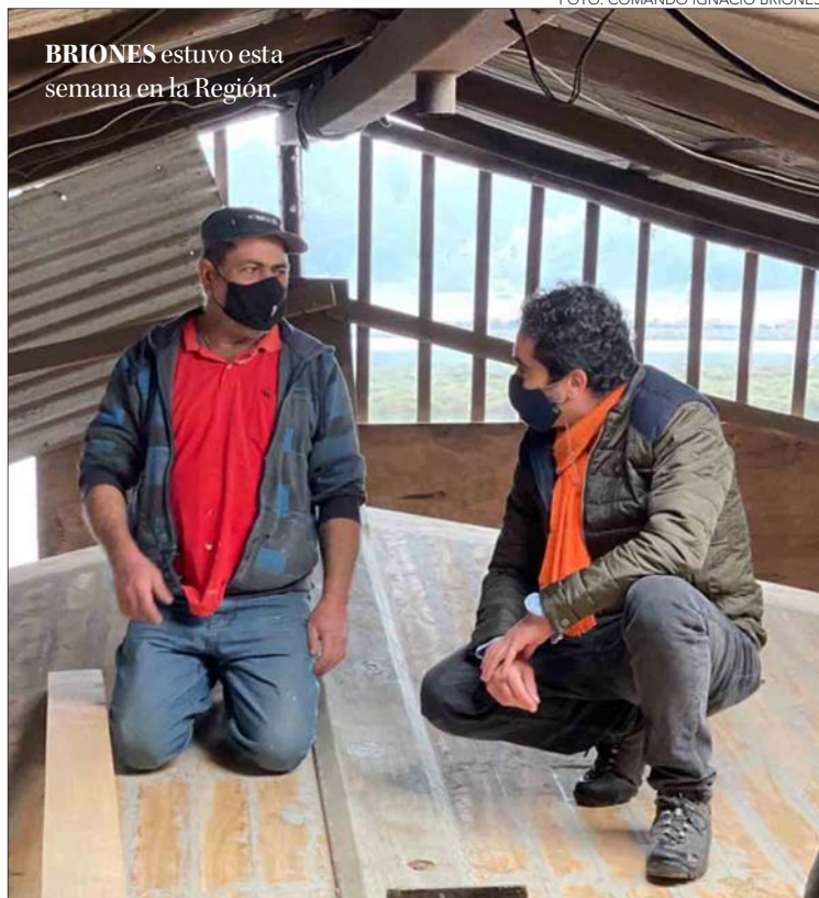
BRIONES estuvo esta semana en la Región.