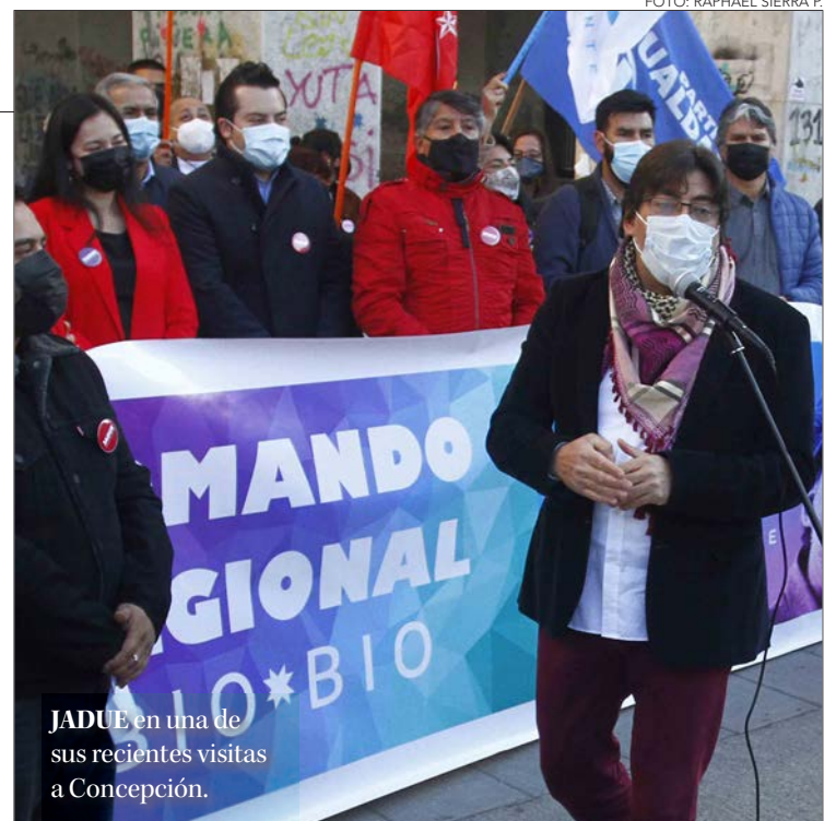
JADUE en una de sus recientes visitas a Concepción.