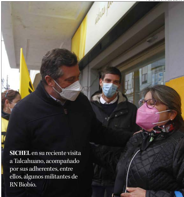
SICHEL en su reciente visita a Talcahuano, acompañado por sus adherentes, entre ellos, algunos militantes de RN Biobío.