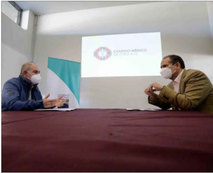
ACUÑA SOLICITÓ también la construcción de un hospital intercultural.

En esa línea, Acuña detalló que “la centralización, en el caso de la pandemia, nos ha venido a mostrar que por su culpa hay más enfermos y más personas que han muerto. Por eso, queremos pedirle al Gobernador que él tenga las facultades para los nombramientos y la dirección de los Servicios de Salud; que se fusionen los Servicios de Salud de Talcahuano y