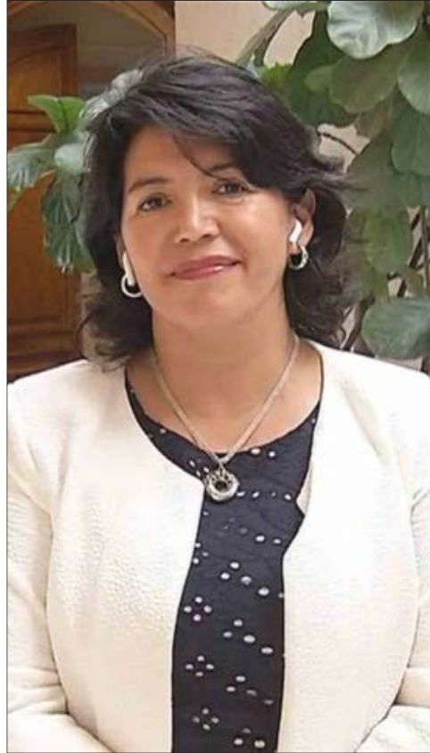
YASNA PROVOSTE candidata de la DC.