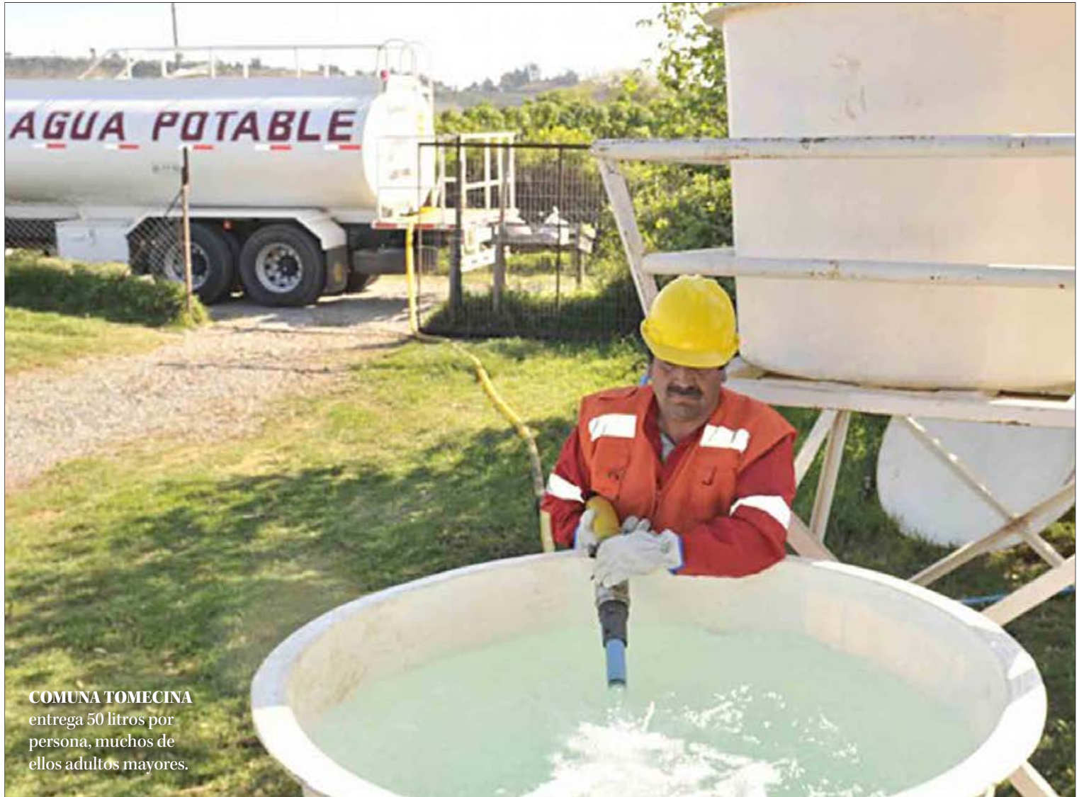
COMUNA TOMECA entrega 50 litros por persona, muchos de ellos adultos mayores.

Agregó que “vamos a crear la Mesa del Agua, con el fin de que todos los