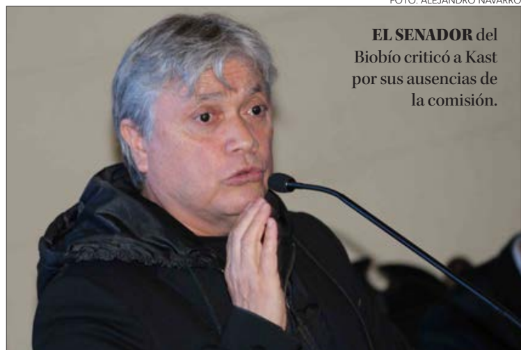
EL SENADOR del Biobío criticó a Kast por sus ausencias de la comisión.