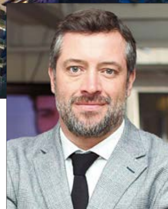
SEBASTIÁN SICHEL ganador primarias de Chilevamos