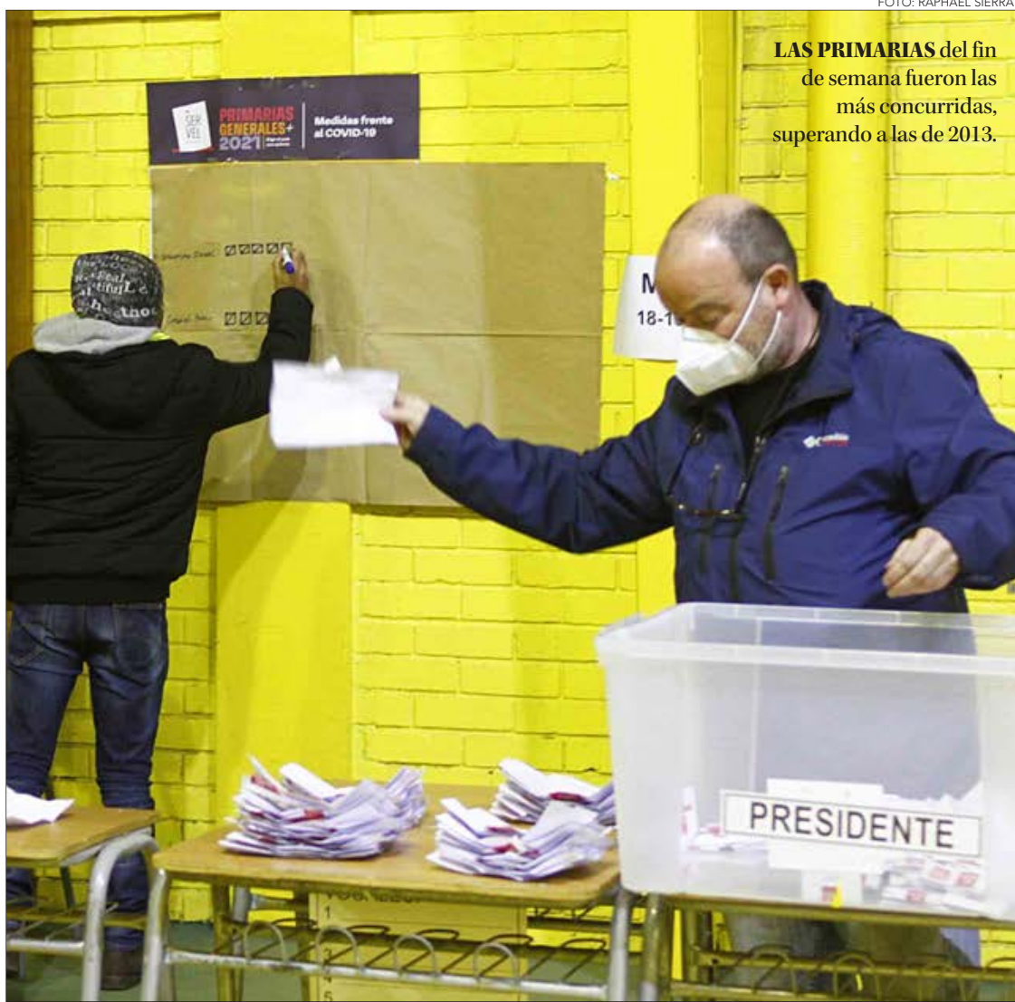
LAS PRIMARIAS del fin de semana fueron las más concurridas, superando a las de 2013.

Apuntó a "un mecanismo de cara a la ciudadanía y sin cocina (...). Necesitamos más que nunca una primaria con enfoque de género. Las del fin de semana, compitieron pu-