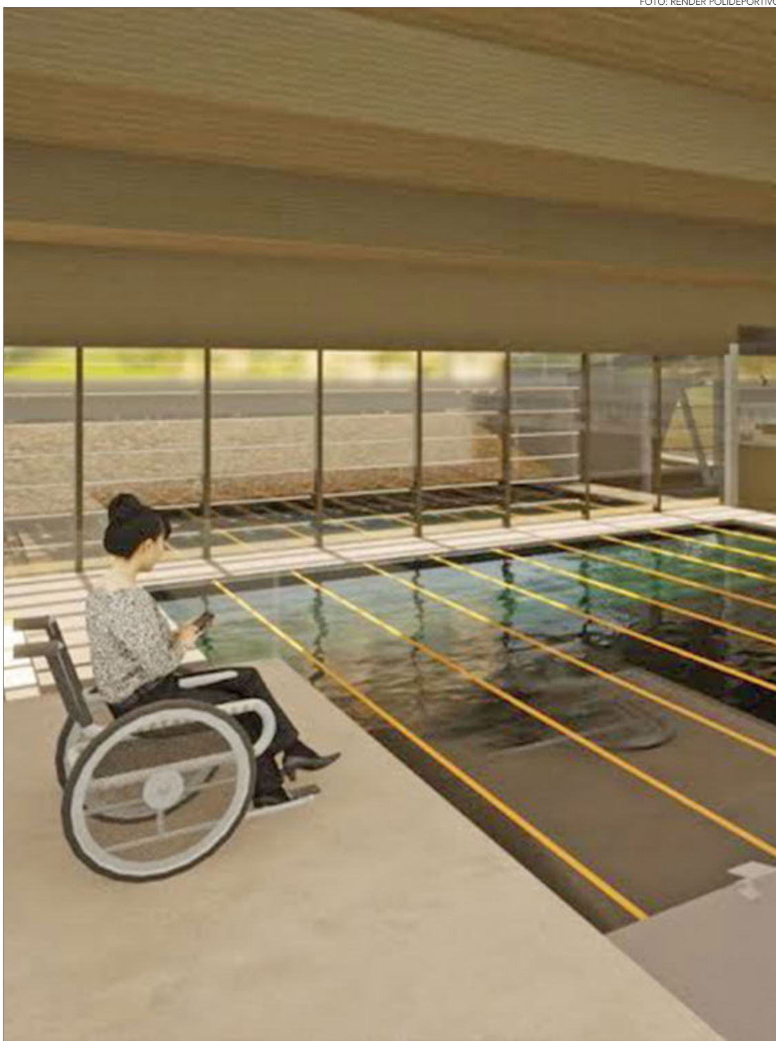
FOTO: RENDER POLIDEPORTIVO