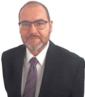
MAURICIO HURTADO NAVIA Embajador de Chile en Cuba.

La Cancillería de Chile viene desarrollando desde hace varios años proyectos específicos para abordar desafíos conjuntos con países amigos. En el marco de estos proyectos hemos identificado diversas áreas de colaboración con Cuba que, por ser un país latinoamericano y en desarrollo, enfrenta en general retos muy similares a los nuestros. Entre estos desafíos está, sin duda, el envejecimiento poblacional, materia en la cual Cuba ha