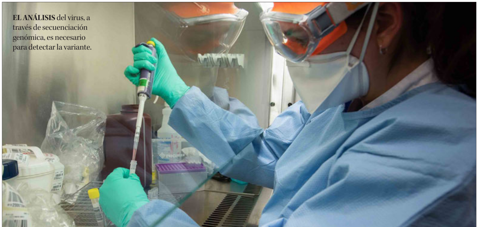
EL ANÁLISIS del virus, a través de secuenciación genómica, es necesario para detectar la variante.

Hasta el momento, según confirmó la jefa de Salud Pública de la Seremi, Cecilia Soto, en la Región se han detectado 46 casos comunitarios, 36 de brasilera y 10 de la Reino Unido, además de cinco casos en viajeros, confirmados gracias al proceso de secuenciación genómica que reali-