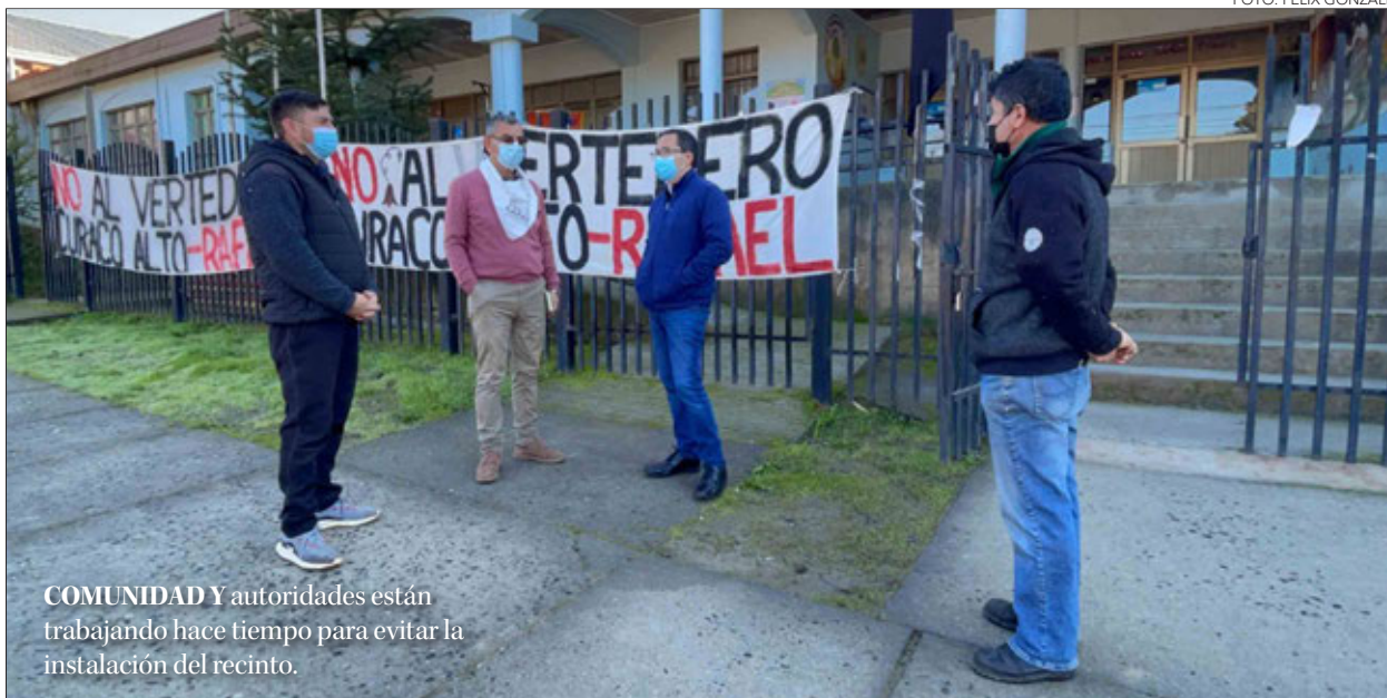
COMUNIDAD Y autoridades están trabajando hace tiempo para evitar la instalación del recinto.

“Esto genera un riesgo de contaminación, accidentes como el que tuvo hace poco Copiulemu. La comunidad y nosotros como ecologistas te-