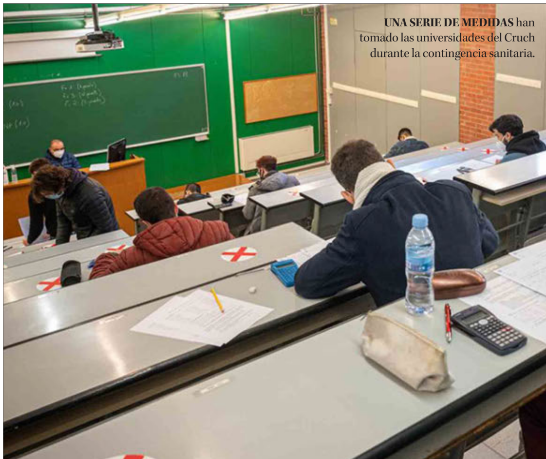
UNA SERIE DE MEDIDAS han tomado las universidades del Cruch durante la contingencia sanitaria.

Parlamentarios aducen que las casas de estudios durante el año 2020 dejaron de percibir alrededor de $228 mil millones entre distintas situaciones, a ello se suma que el Ministerio de Educación no ha entregado soluciones a la problemática.