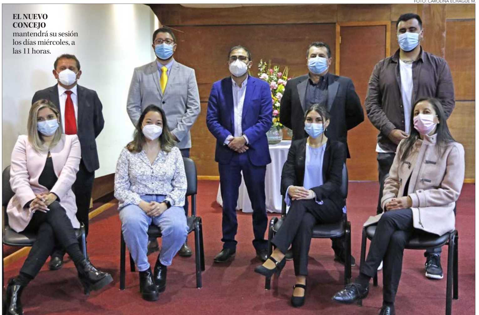
EL NUEVO CONCEJO mantendrá su sesión los días miércoles, a las 11 horas.