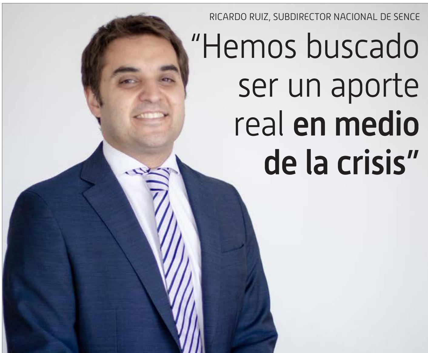
RICARDO RUIZ, SUBDIRECTOR NACIONAL DE SENCE

El empleo ha estado en el centro de nuestro quehacer siempre y, muy particularmente, en el último año. Hemos visto cómo la pandemia impactó en un aumento significativo del desempleo y en una fuerte disminución en la participación laboral, sobre todo de las mujeres. Dado lo anterior, es que creamos cuatro subsidios para impulsar el empleo; dos orientados a las empresas, sin