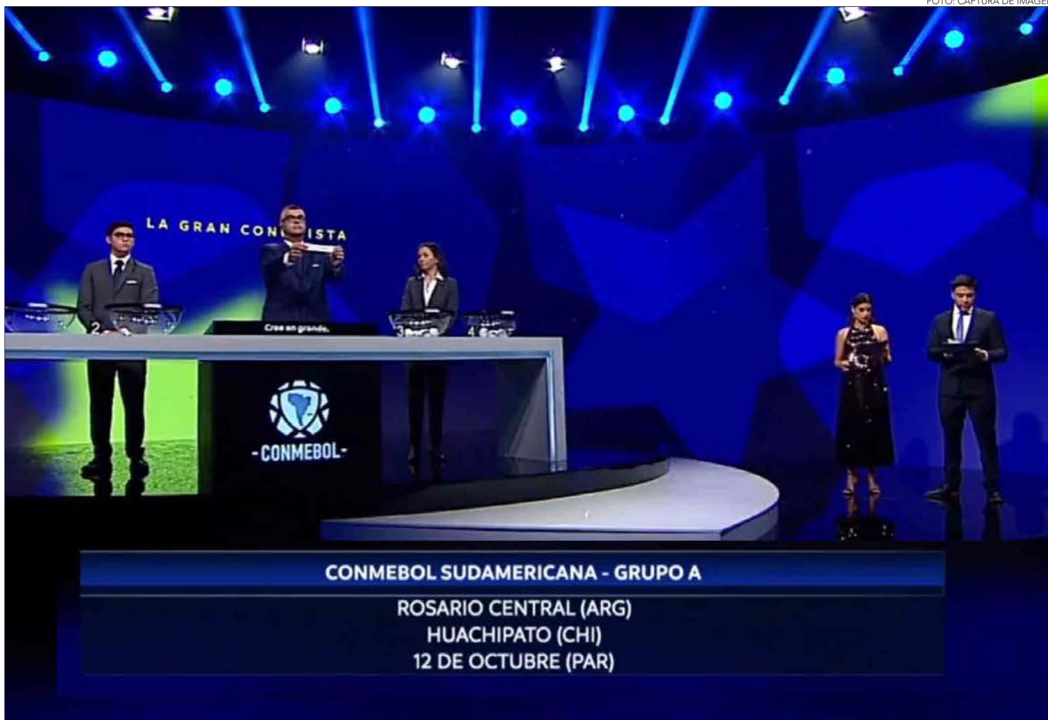
SORTEO SE REALIZÓ AYER EN ASUNCIÓN