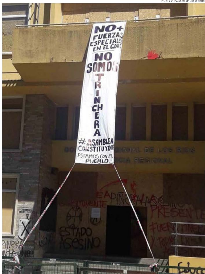
LA DIRIGENTA dijo que la gente confunde los roles del Gobierno Regional e Interior, tal como ocurrió durante el estallido social, y que en cohabitación será peor. Aquí una imagen del Gore de Los Ríos.

Siendo el terreno del Serviu, Intendencia pidió traspasar el comodato a ella y al Gobierno Regional.