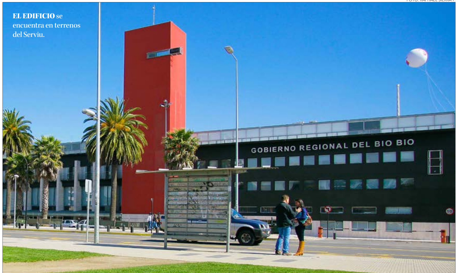
EL EDIFICIO se encuentra en terrenos del Serviu.

Mientras, parlamentarios y organismos se mostraron contrarios a la propuesta que se ejecuta desde el Ministerio del Interior para que ambas autoridades compartan, en el caso de la Región, el edificio de calle Prat.