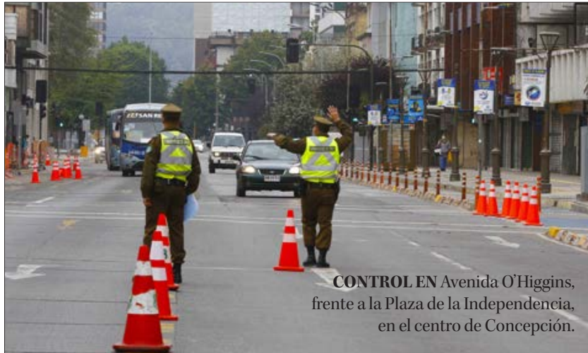
CONTROL EN Avenida O'Higgins, frente a la Plaza de la Independencia, en el centro de Concepción.

“En la red regional de salud pública y privada tenemos un total de 267 camas UCI y 128 camas UTI, con 7 y 28 disponibles respectivamente, que equivalen al 3% y 22% de disponibilidad respectivamente, contando, además, con una alta capacidad de reconversión, pudiendo derivar pacientes a recintos de la misma Región u a otras regiones del país de ser necesario. La dotación de ventila-