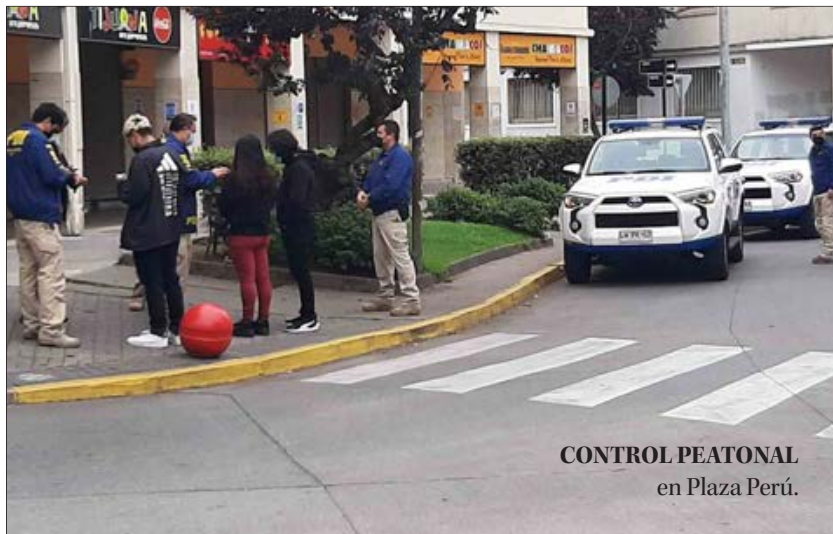
CONTROL PEATONAL en Plaza Perú.