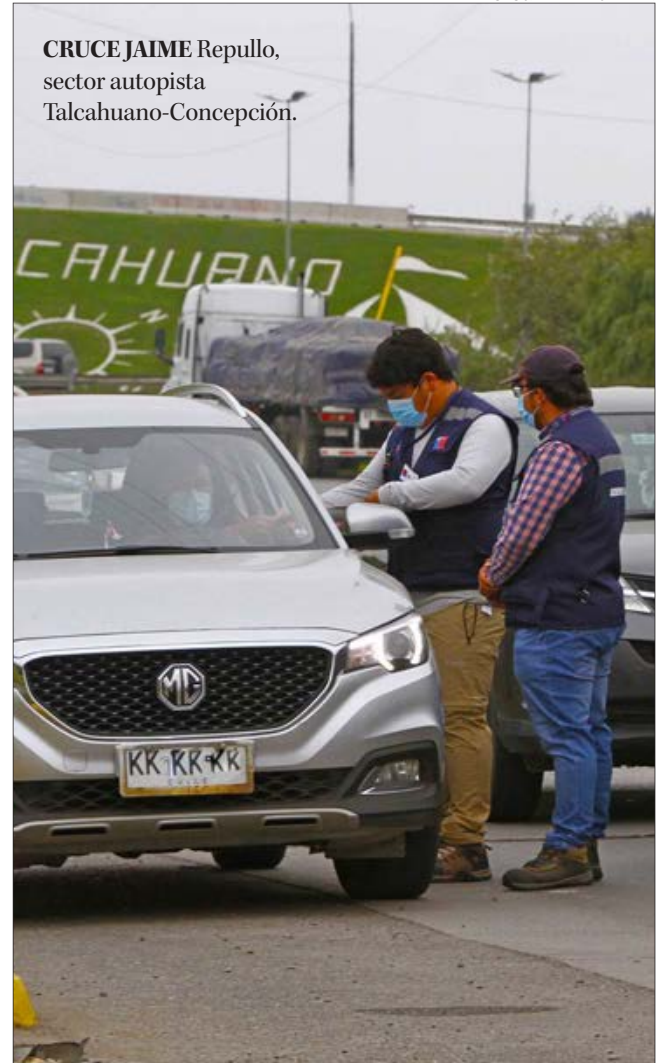
CRUCE JAIME Repullo, sector autopista Talcahuano-Concepción.