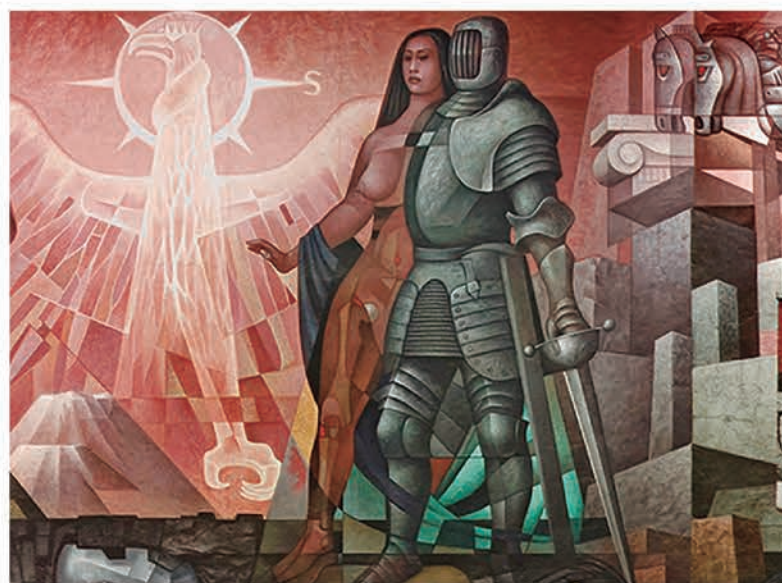
Detalle del mural: pareja primigenia

Como todo mural este se despliega en un relato, en este caso Americanista, que exalta la herencia primigenia de las civilizaciones originarias,