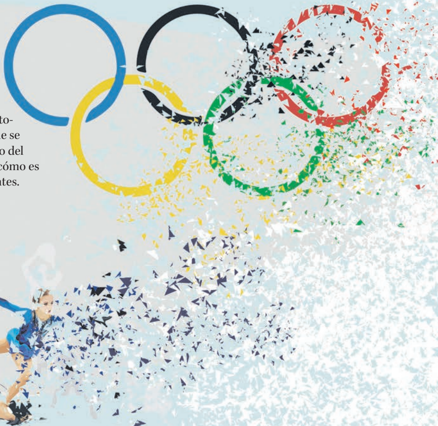
ILUSTRACIÓN: PAULINA PARRA CH.