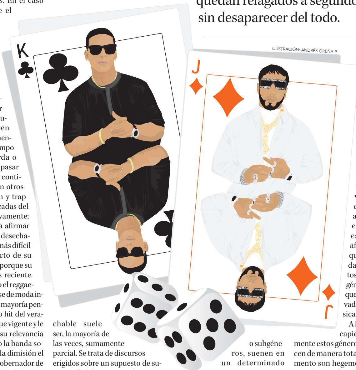
ILUSTRACIÓN: ANDRÉS OREÑA P.

Twitter @DiarioConce contacto@diarioconcepcion.cl