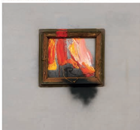
Sin título, José Balmes

Son innumerables las tendencias de la pintura contemporánea y en casi todas hay un componente rupturista. Esta exposición reúne a un grupo de artistas que produjeron sus obras en Chile, desde la década del 60 en adelante, algunos dejan un legado visual de innegable importancia histórica de la época que les tocó vivir. Otros siguen activos, abocados a la tarea de explorar las maneras de transmitir aquello, lo que es pertinente a su tiempo y realidad.