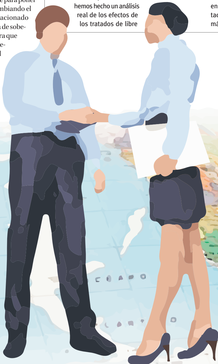
ILUSTRACIÓN: PAULINA PARRA CH.

“En este sentido, creo que la pérdida está dada por las oportunidades que brinda el mundo, en este caso 10 países del Asia Pacífico, a las que aún no se puede acceder por no estar el Tratado ratificado”.