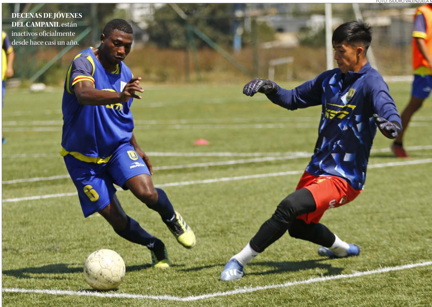
DECENAS DE JÓVENES DEL CAMPANIL están inactivos oficialmente desde hace casi un año.

A la espera de información oficial en un escenario que por ahora se ve adverso en cuanto al retorno, el jefe técnico del fútbol joven de UdeC dijo que “para nosotros lo primero