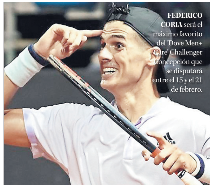
FEDERICO CORIA será el máximo favorito del 'Dove Men+Care' Challenger Concepción que se disputará entre el 15 y el 21 de febrero.

Twitter @DiarioConce contacto@diarioconcepcion.cl