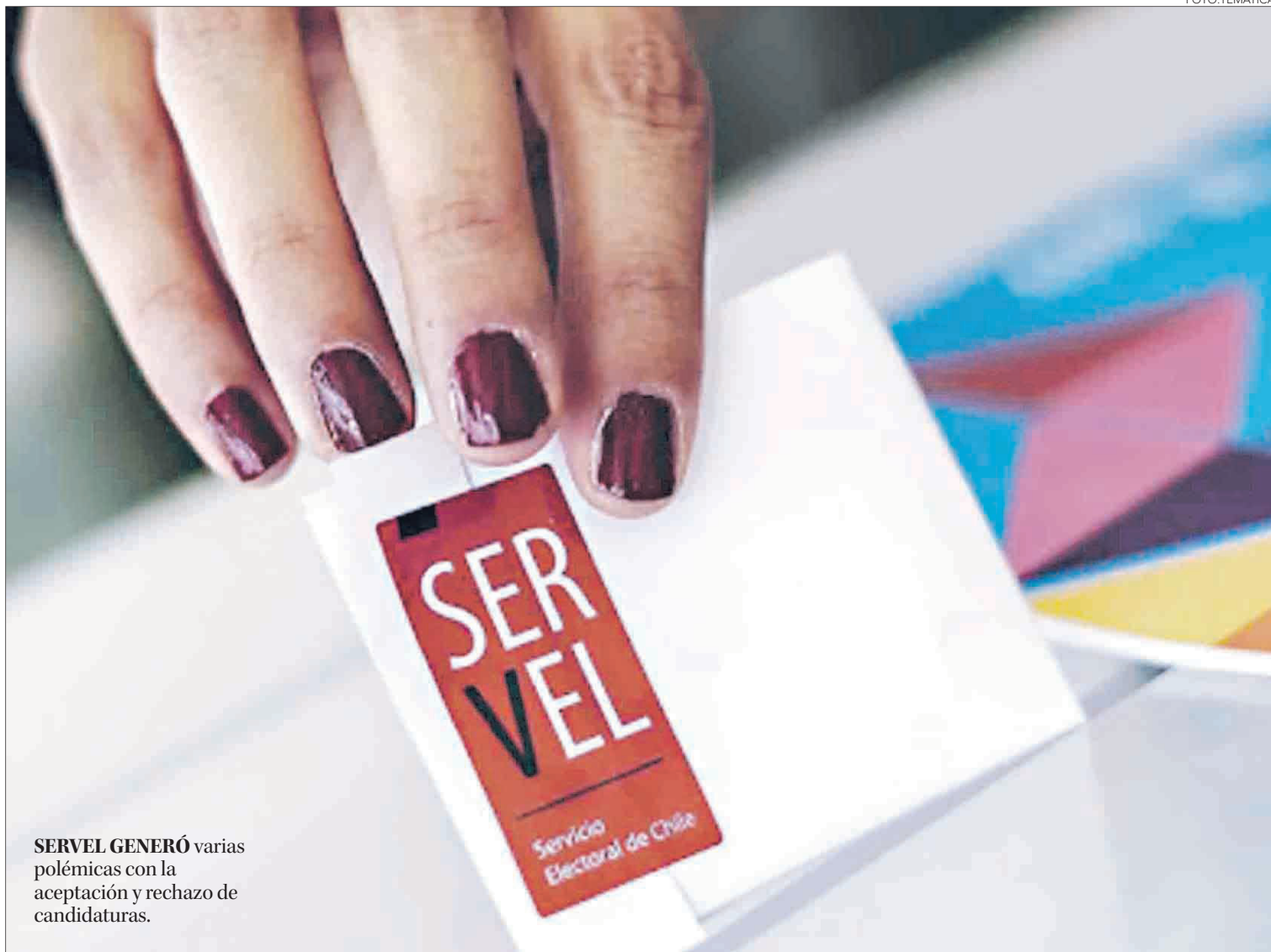
SERVEL GENERÓ varias polémicas con la aceptación y rechazo de candidaturas.

Sobre las instancias que vienen, el abogado indicó que la instancia de reclamación está abierta y que la próxima semana habrá mayor claridad respecto al tema. “Cuando