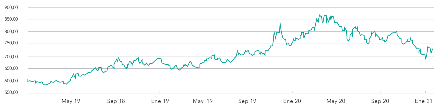
DÓLAR OBSERVADO ENERO 2018 A ENERO 2021

INESTABILIDAD en el valor de la divisa norteamericana será la tendencia, debido al proceso de vacunación, su velocidad y aparición de nuevas cepas.