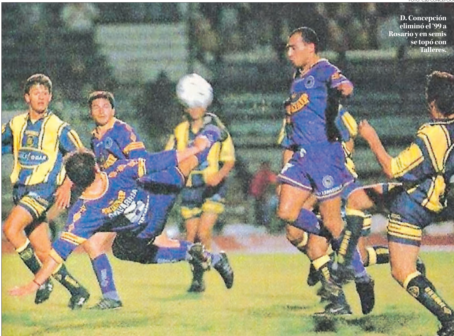
D. Concepción eliminó el '99 a Rosario y en semis se topó con Talleres.