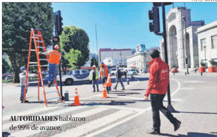
AUTORIDADES hablaron de 99% de avance.