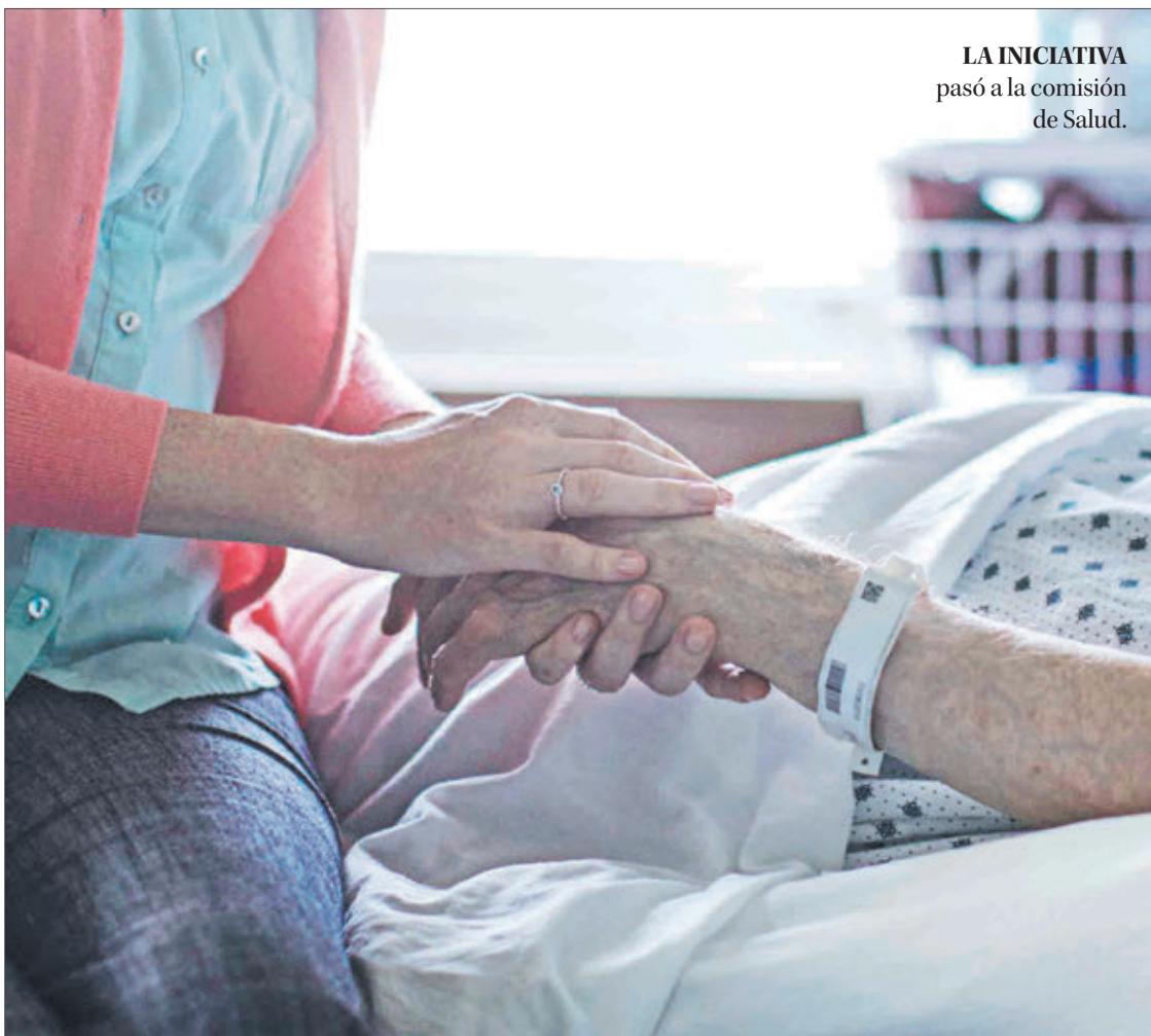
LA INICIATIVA pasó a la comisión de Salud.