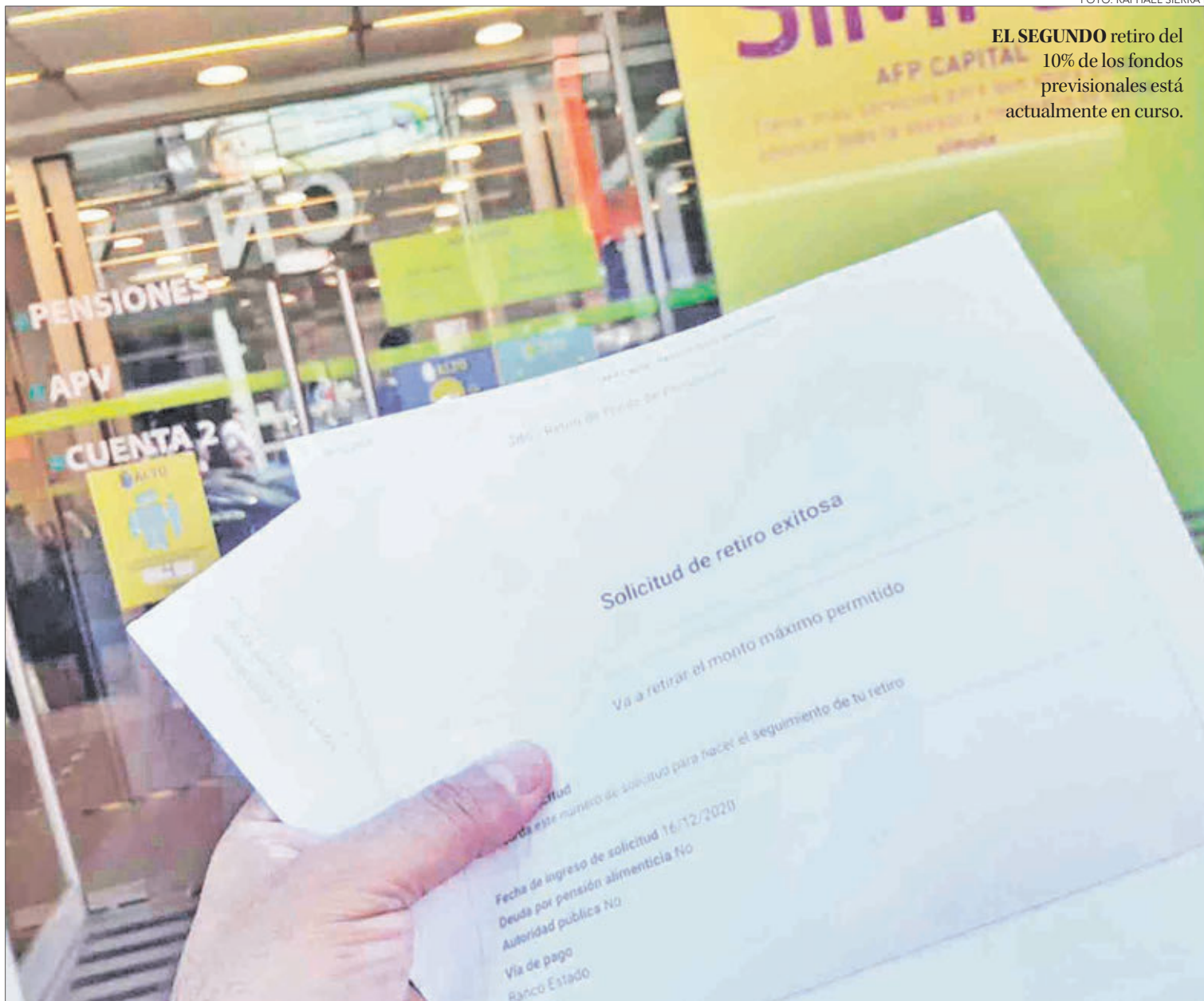
EL SEGUNDO retiro del 10% de los fondos previsionales está actualmente en curso.

“Lo encuentro impresentable. Junto con obedecer a una maniobra política electoral, está orientado a quienes tienen menos problemas económicos. Quienes retiraron los fondos en los dos proyectos anteriores, sin duda eran quienes tenían mayores recursos previsionales. Hoy hay 4 millones de chilenos que no podrán retirar”, explicó