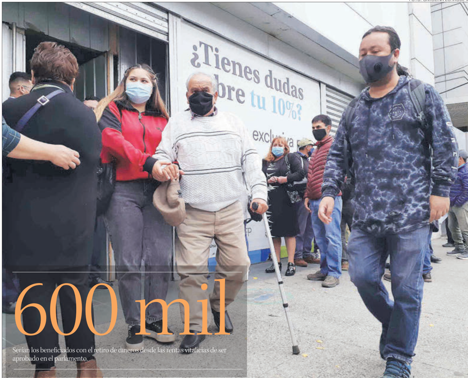
Serían los beneficiados con el retiro de dineros desde las rentas vitalicias de ser aprobado en el parlamento.

SE ANUNCIÓ INGRESO DE NUEVO PROYECTO DE LEY