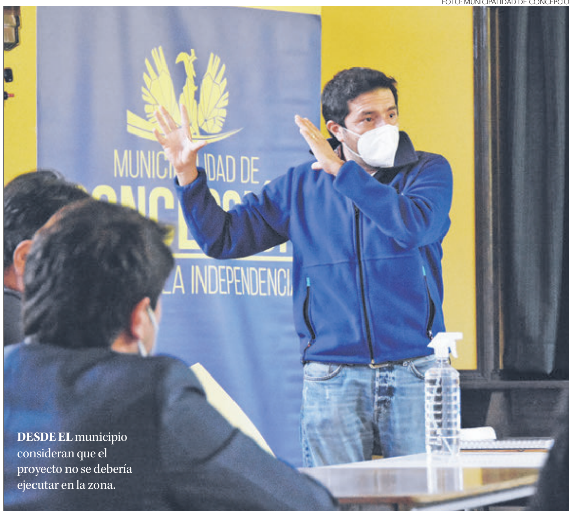
DESDE EL municipio consideran que el proyecto no se debería ejecutar en la zona.

Sobre los impactos ambientales y la naturaleza del proyecto se solici-