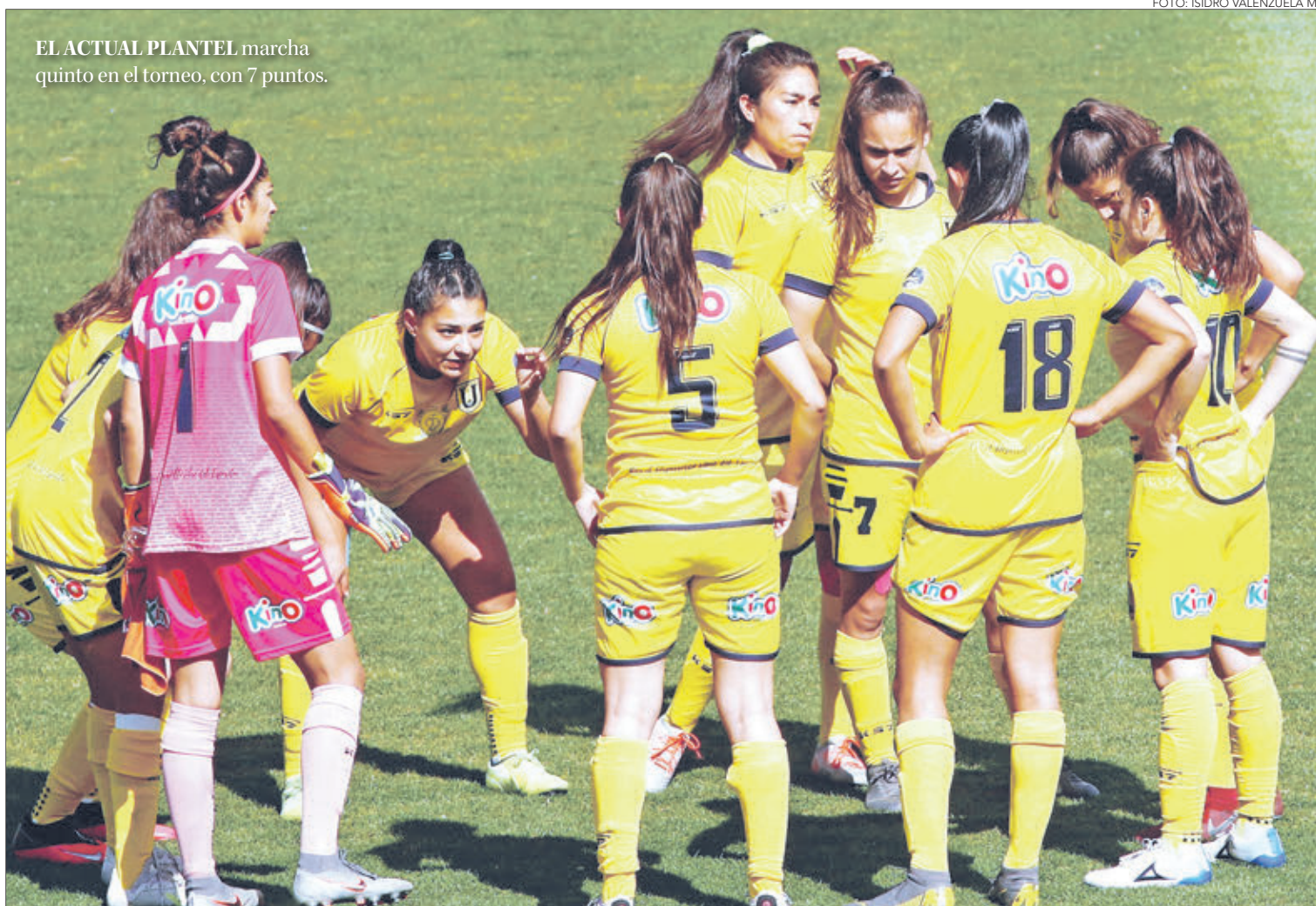
EL ACTUAL PLANTEL marcha quinto en el torneo, con 7 puntos.

Twitter @DiarioConce contacto@diarioconcepcion.cl