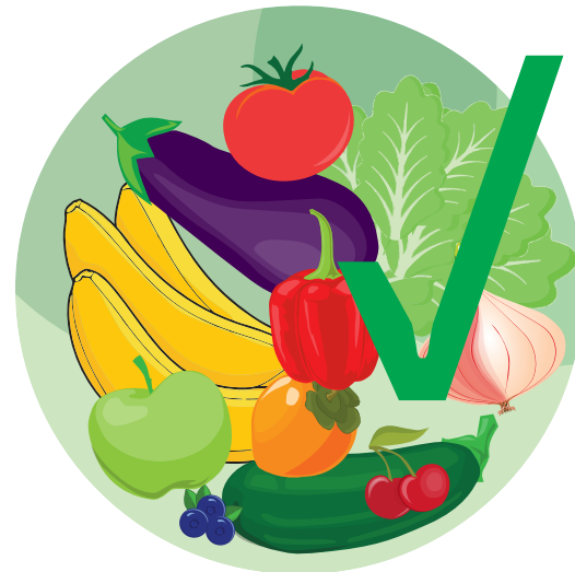
Comer frutas y verduras