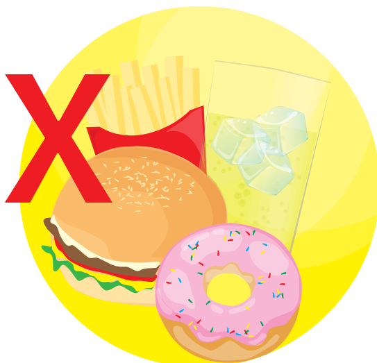
Evitar comida chatarra