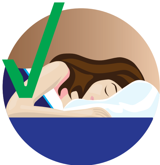
Dormir lo suficiente