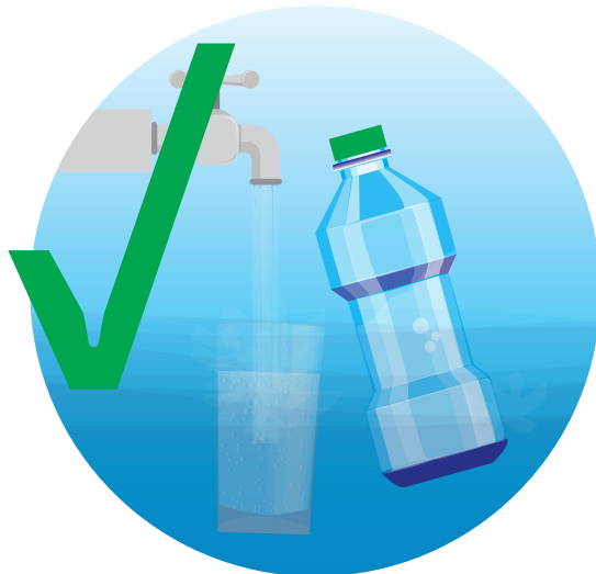
Mantenerse hidratado (beber agua)