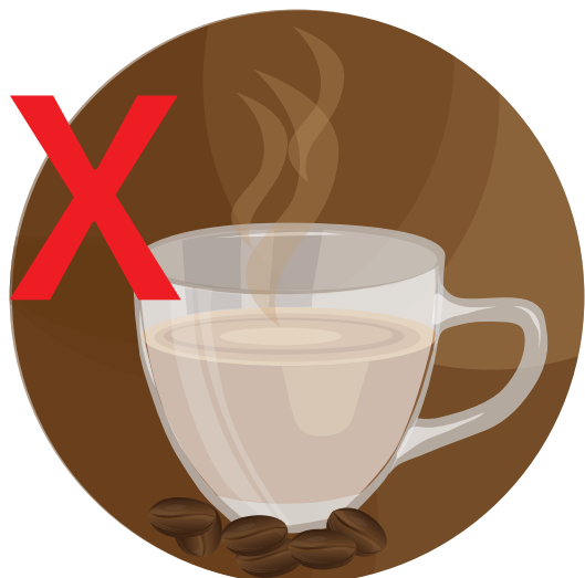
Evitar beber estimulantes (como el café)