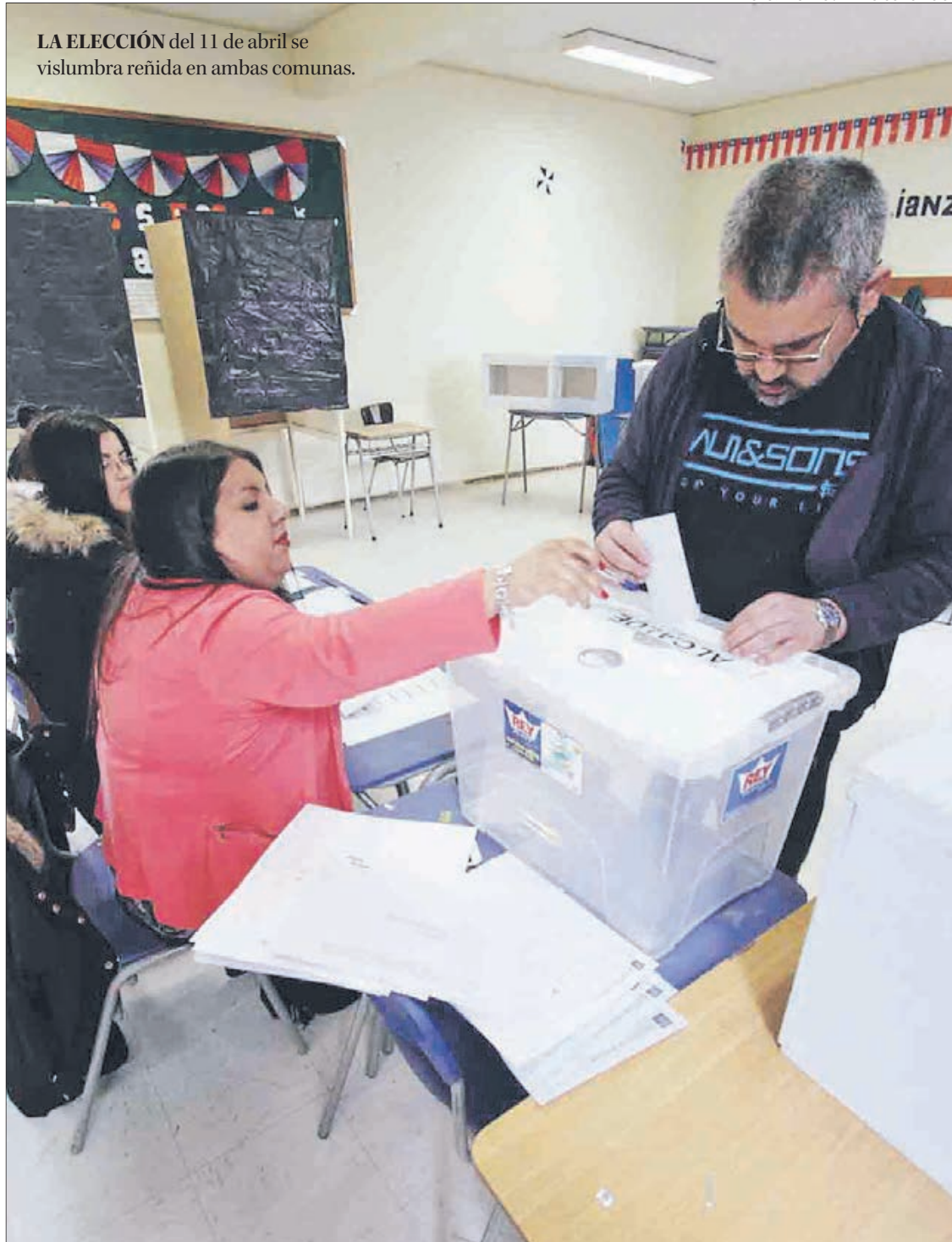
LA ELECCIÓN del 11 de abril se vislumbra reñida en ambas comunas.

Alejandro Valenzuela contacto@diarioconcepcion.cl