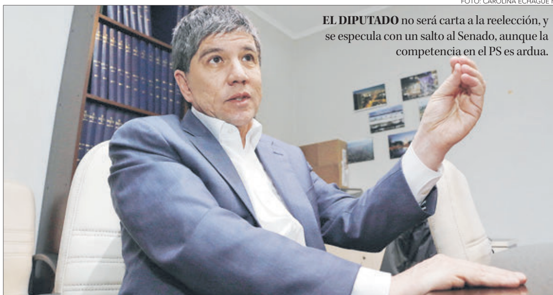
EL DIPUTADO no será carta a la reelección, y se especula con un salto al Senado, aunque la competencia en el PS es ardua.

A pesar de su negativa para estar en la papeleta de 2021, el diputado sostiene estar dispuesto a cualquier tarea del PS, siempre y cuando ésta sea colectiva. La tienda política que definió el 27 de noviembre como fecha en que el Comité Central deberá abordar la situación presidencial. Por el momen-