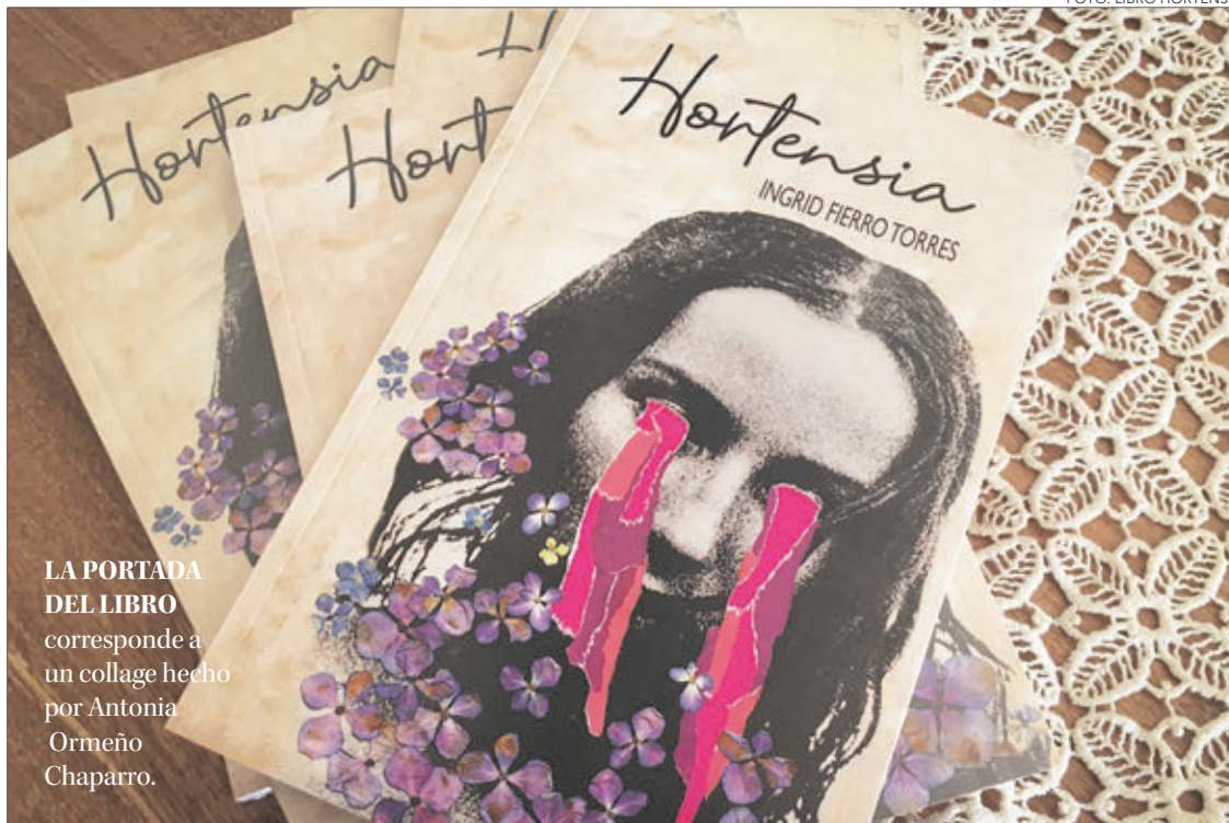
LA PORTADA DEL LIBRO corresponde a un collage hecho por Antonia Ormeño Chaparro.