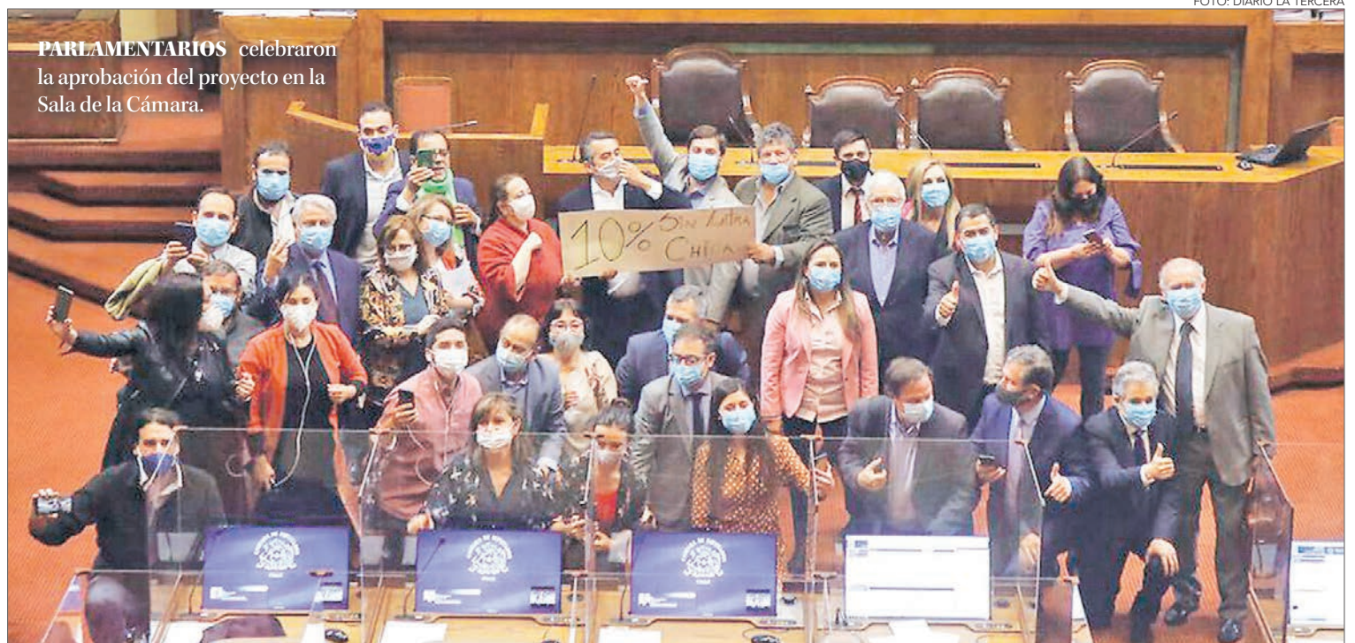
PARLAMENTARIOS celebraron la aprobación del proyecto en la Sala de la Cámara.

La mayoría de los parlamentarios de la Región votaron a favor de la moción, salvo una excepción. Ahora la iniciativa será despachada al Senado para su análisis y posterior votación. Se espera que su tramitación inicie el próximo jueves.