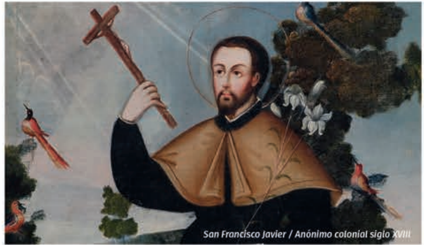
San Francisco Javier / Anónimo colonial siglo XVIII

Pintura colonial. Religiosidad popular / Pinacoteca UdeC